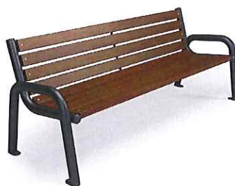
Fot. nr 5 – Przykładowy wygląd ławki z oparciem.