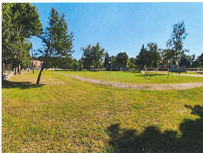
Fot. 3. Widok od strony ul. Grunwaldzkiej.