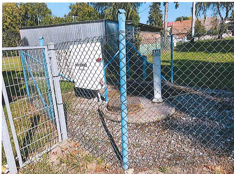
Fot. 4. Widok na działkę nr ewid. 284/1 obręb 0004 Dębno.