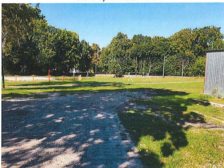
Fot. 2. Widok na część północno-zachodnią działki 284/2 obręb 0004 Dębno