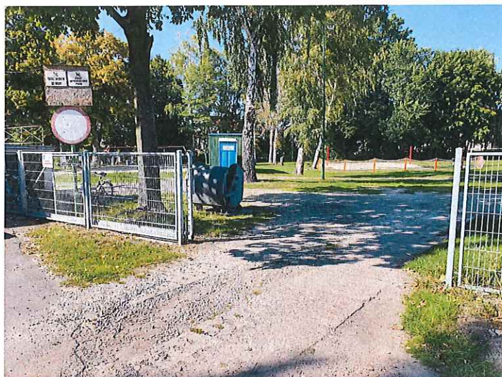
Fot. 1. Wjazd na teren OSiR