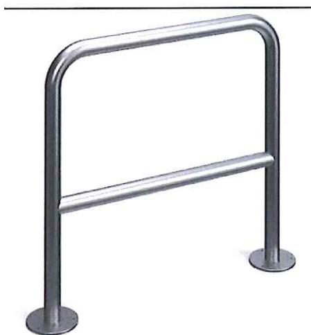
Fot. nr 7 – Przykładowy wygląd stojaka na rowery

Stojaki montowane w odstępach 1,2 m od siebie.