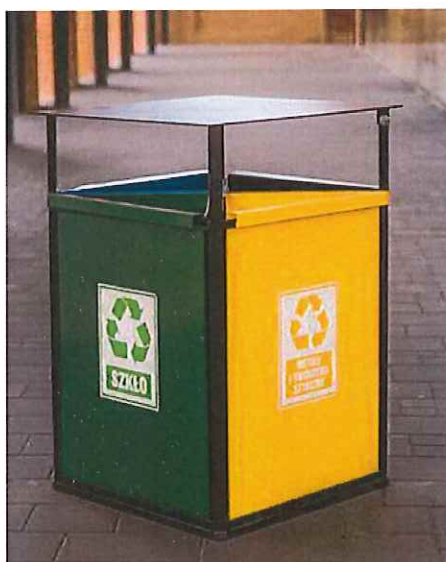
Fot. nr 6 – Przykładowy wygląd kosza na śmieci do segregacji odpadów.

Kosz należy przymocować na stałe do podłoża.