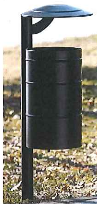
Fot. nr 6 – Przykładowy wygląd kosza na śmieci.

Montaż poprzez zabetonowanie elementu kotwiącego.