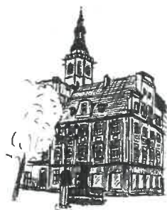
Rynek Wieża ratuszowa