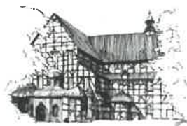
Kościół Pokoju pw. Św. Trójcy Wpisany na listę UNESCO