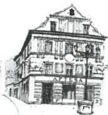
Kamienica „Pod Bykami”