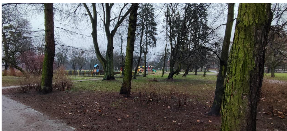
Fot 3. Widok z alejki na plac zabaw.