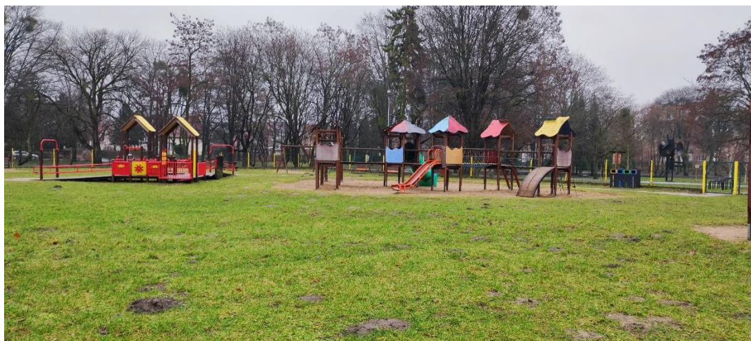
Fot. 6. Widok na istniejący plac zabaw.