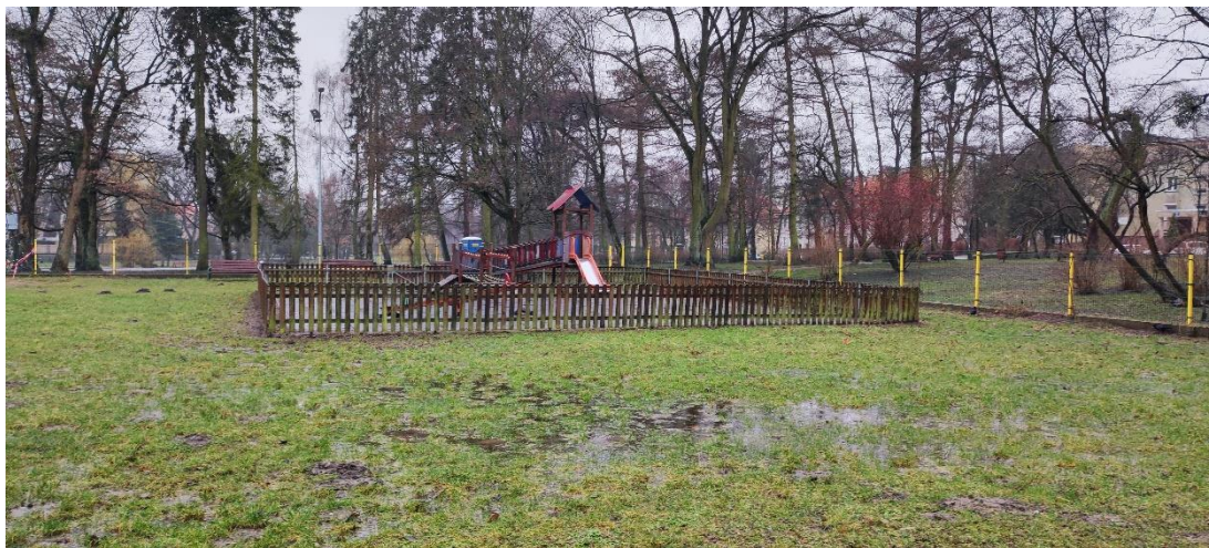
Fot 4. Widok na plac zabaw dla dzieci młodszych.