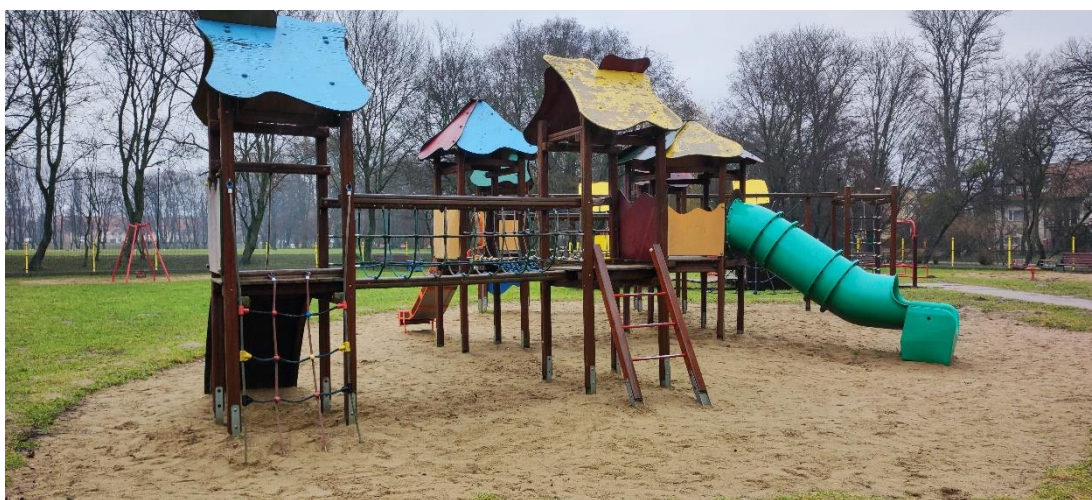
Fot 5. Urządzenie wielofunkcyjne przewidziane do usunięcia.