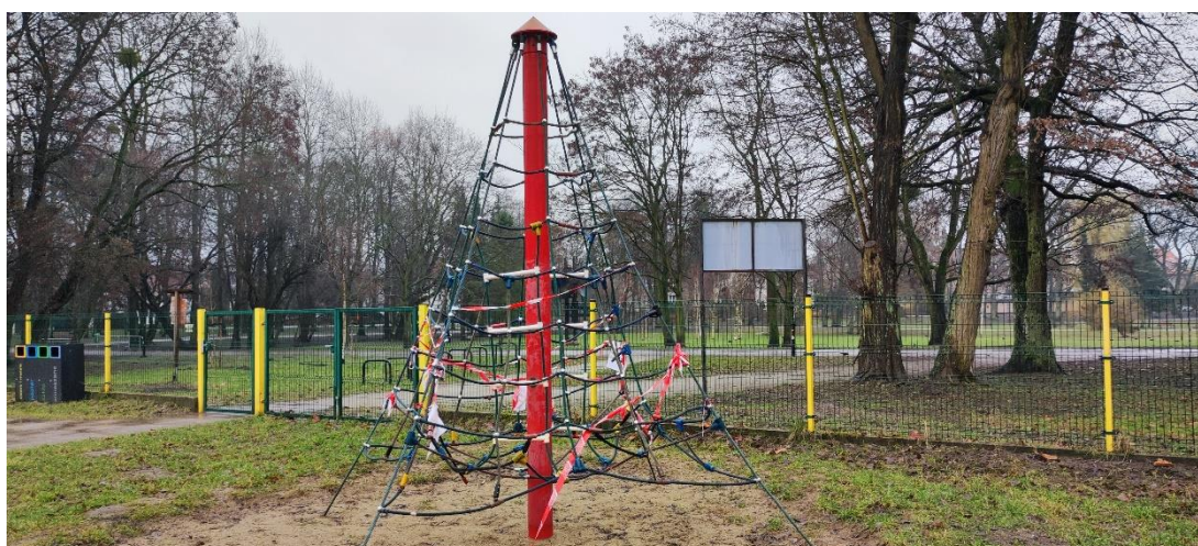
Fot. 7 Linarium – piramida przewidziana do usunięcia.