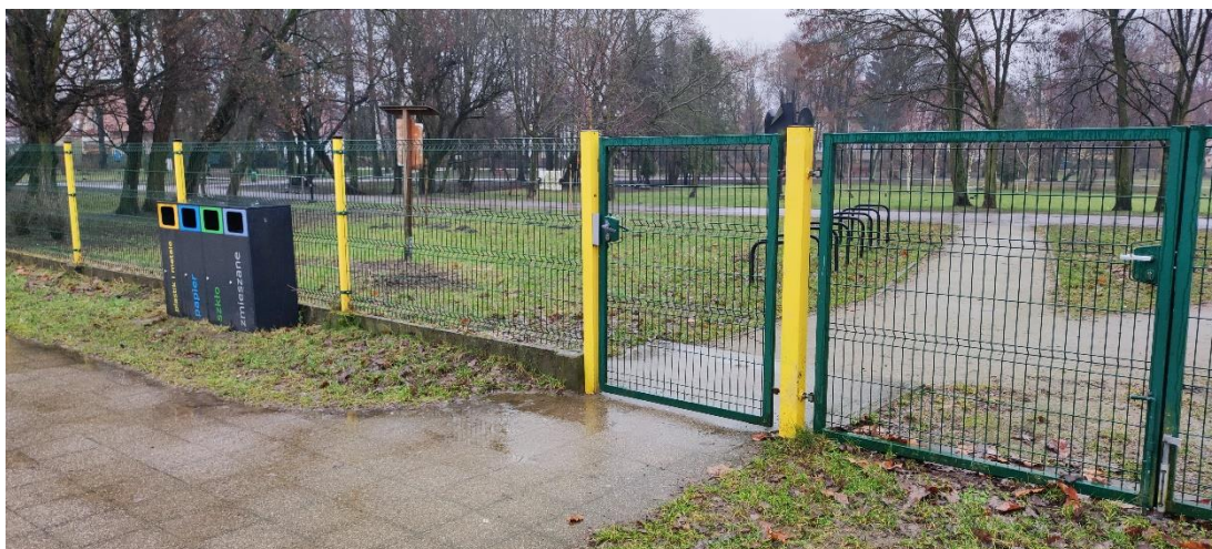
Fot 12. Wejście główne na plac zabaw.