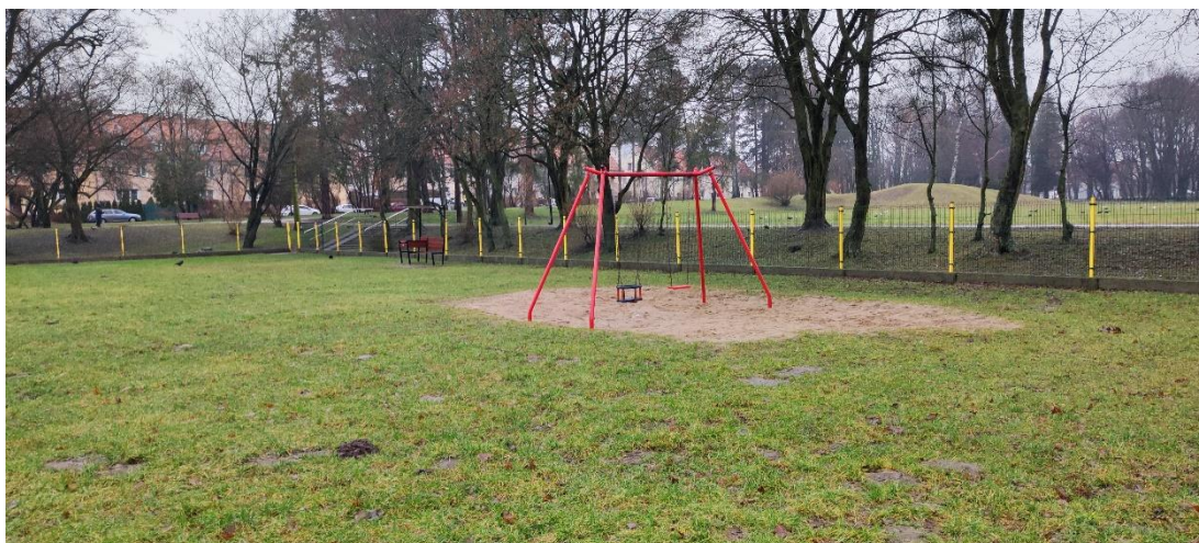
Fot 9. Istniejąca huśtawka – przewidziana do przestawienia.