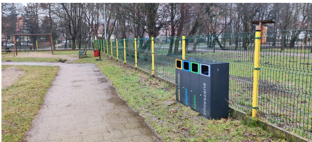
Fot 11. Huśtawka na końcu ścieżki – przewidziana do usunięcia, kosze i ławki pozostają.