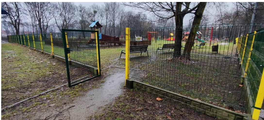
Fot 1. Wejście na plac zabaw od południowo-zachodniej strony.