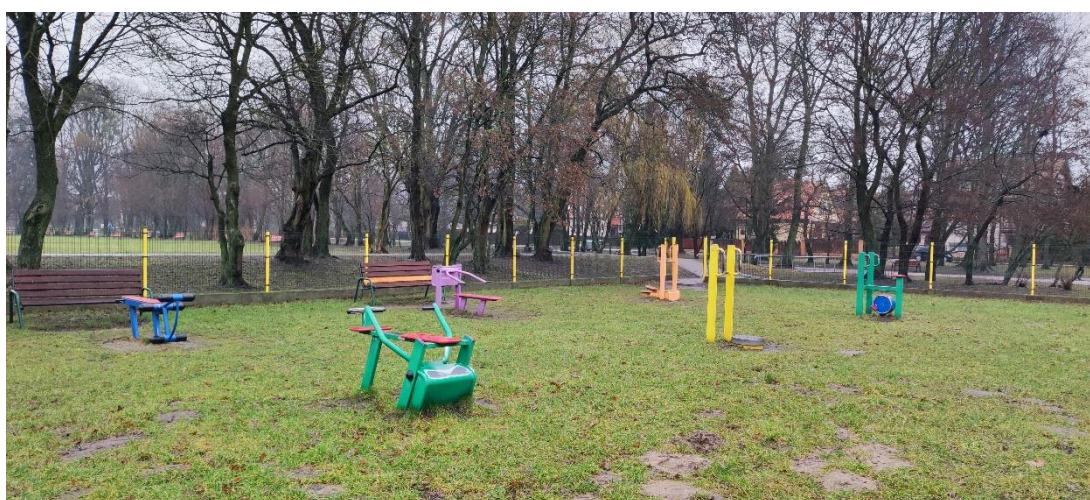
Fot. 8 Urządzenia fitness – przewidziane do usunięcia.