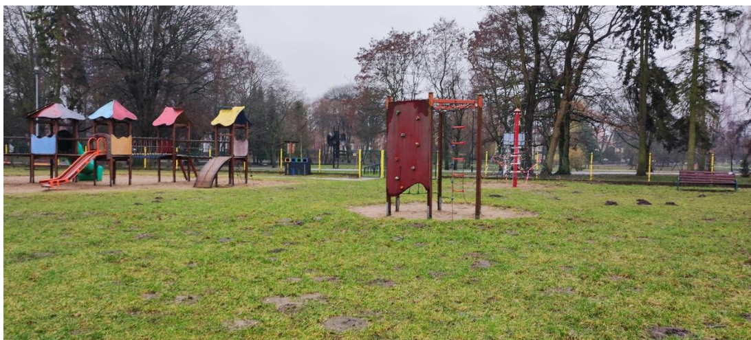
Fot 10. Istniejące urządzenie do wspinania – przewidziane do przestawienia.