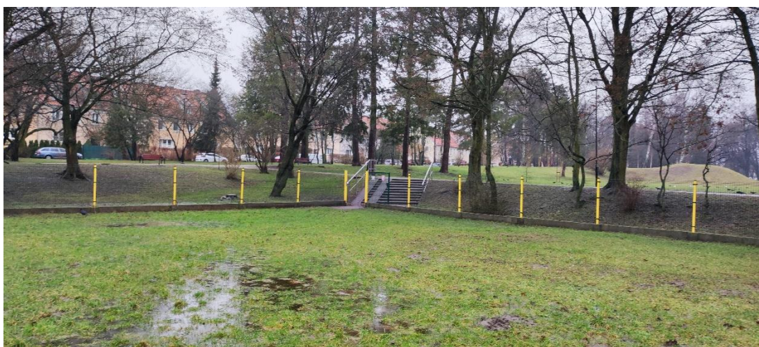
Fot 14. Nawierzchnia trawiasta przy wejściu od płn.-zach. strony z tendencją do stania wody po deszczu.