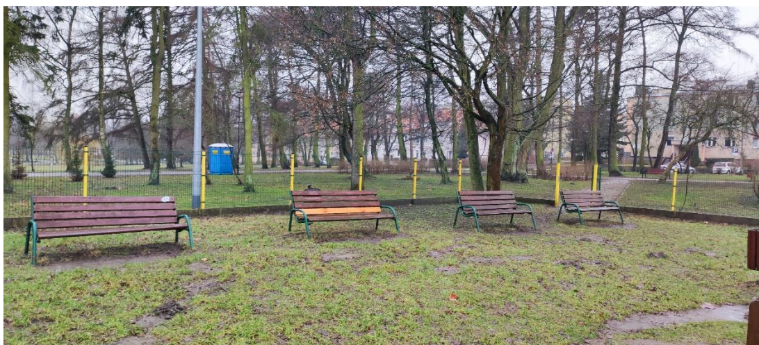
Fot 13. Ławki parkowe – pozostają.