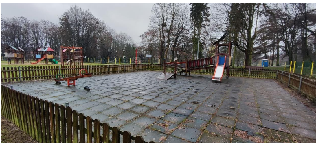
Fot 4. Urządzenia i nawierzchnia na placu zabaw dla młodszych dzieci.