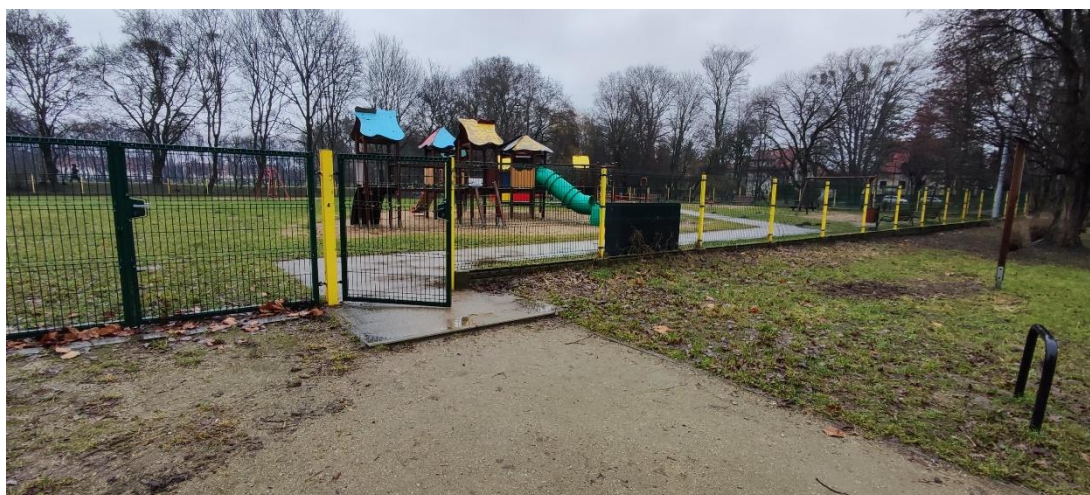
Fot 2. Centralne wejście na plac zabaw, przy bramie od południowej strony.