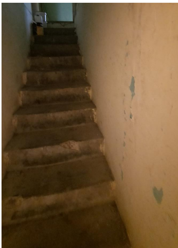
prowadząca do piwnicy