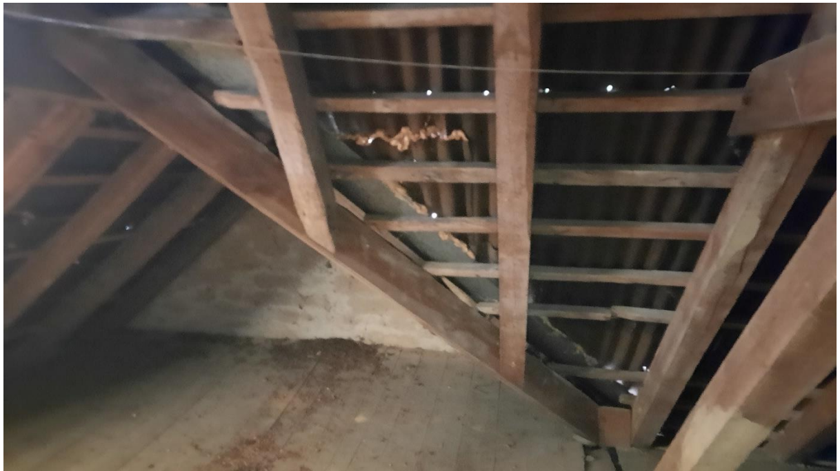
Rys. 16 Więźba dachowa