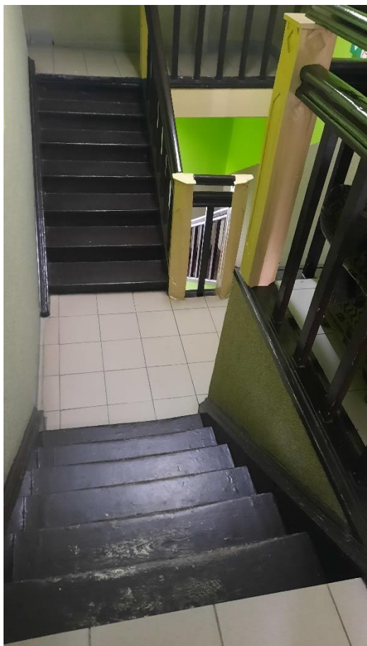
Rys. 12 Wewnętrzna klatka schodowa