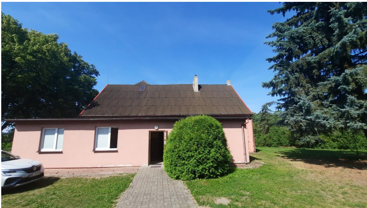
Rys. 6 Elewacja wschodnia