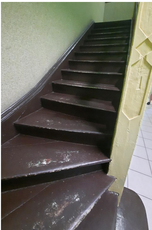
Rys. 9 Wewnętrzna klatka schodowa