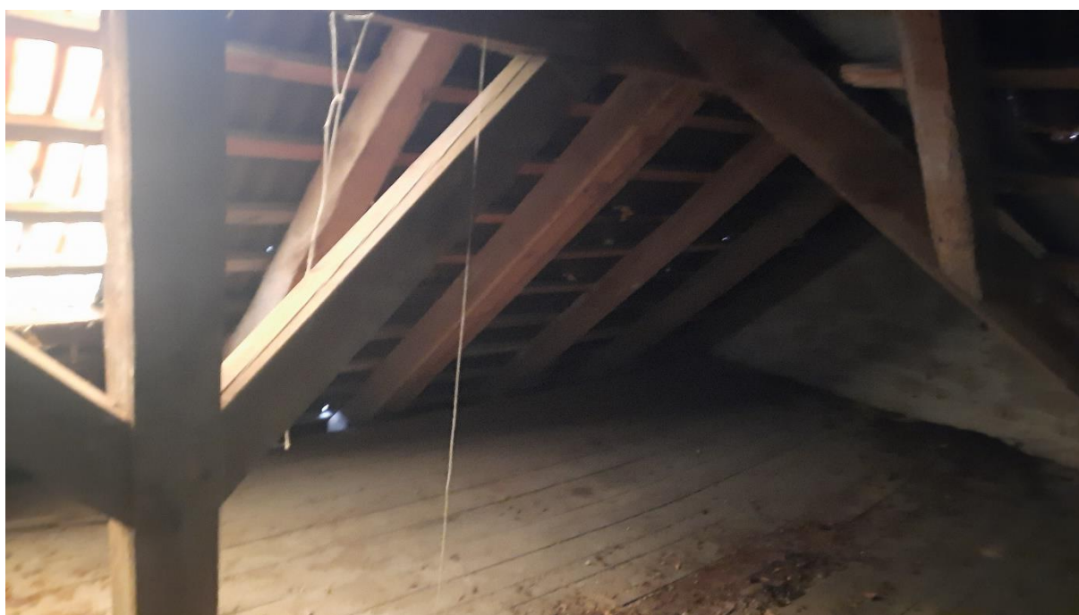
Rys. 15 Wieżba dachowa