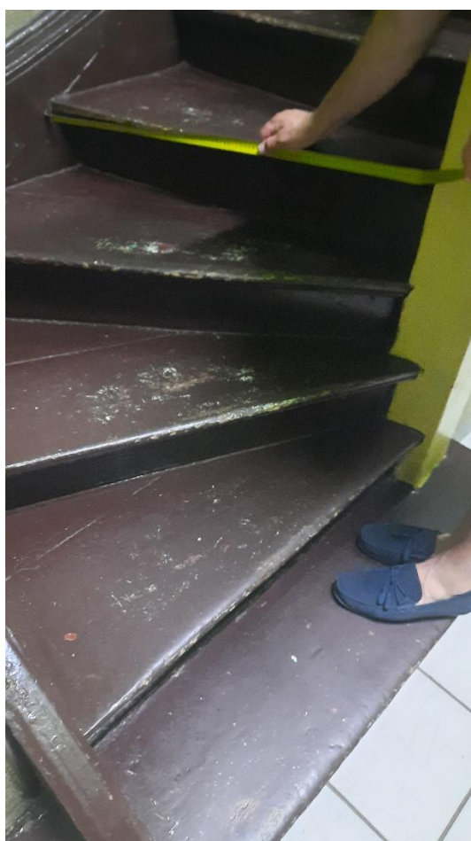
Rys. 10 Wewnętrzna klatka schodowa