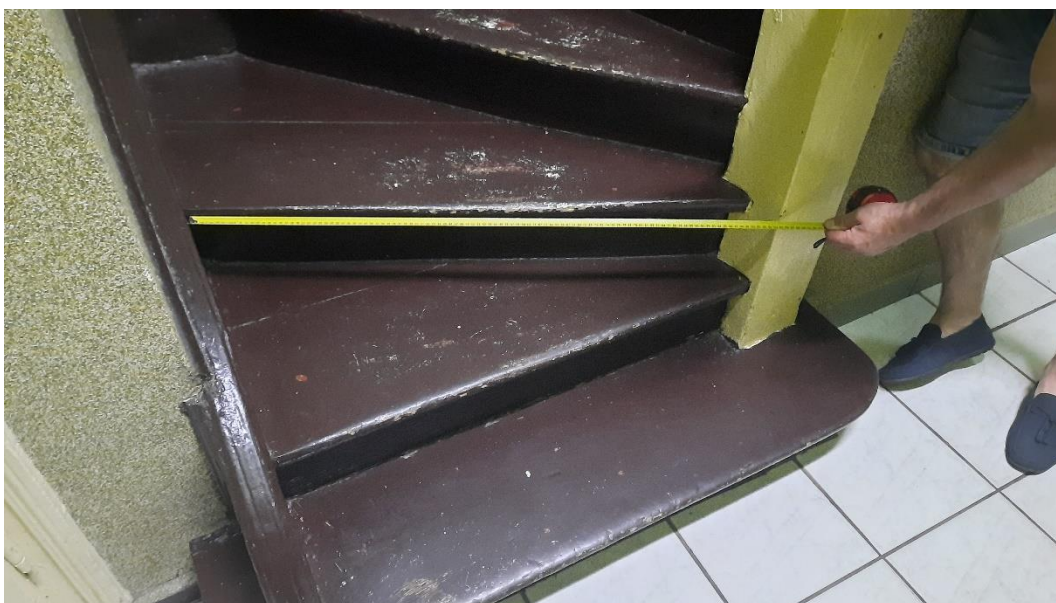
Rys. 11 Wewnętrzna klatka schodowa