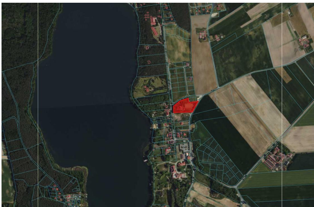
Rys. 1 Lokalizacja budynku na mapie miejscowości Chomiąży Szlacheckiej

Budynki zlokalizowane na działce nr 149, obręb 0003, jednostka ewidencyjna 041902_2.