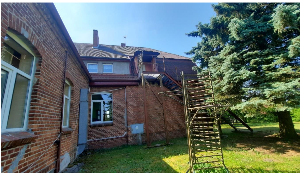
Rys. 4 Elewacja północna