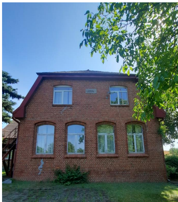
Rys. 8 Elewacja zachodnia