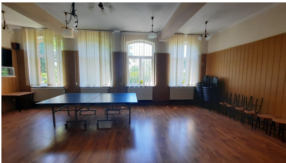
Rys. 14 Sala