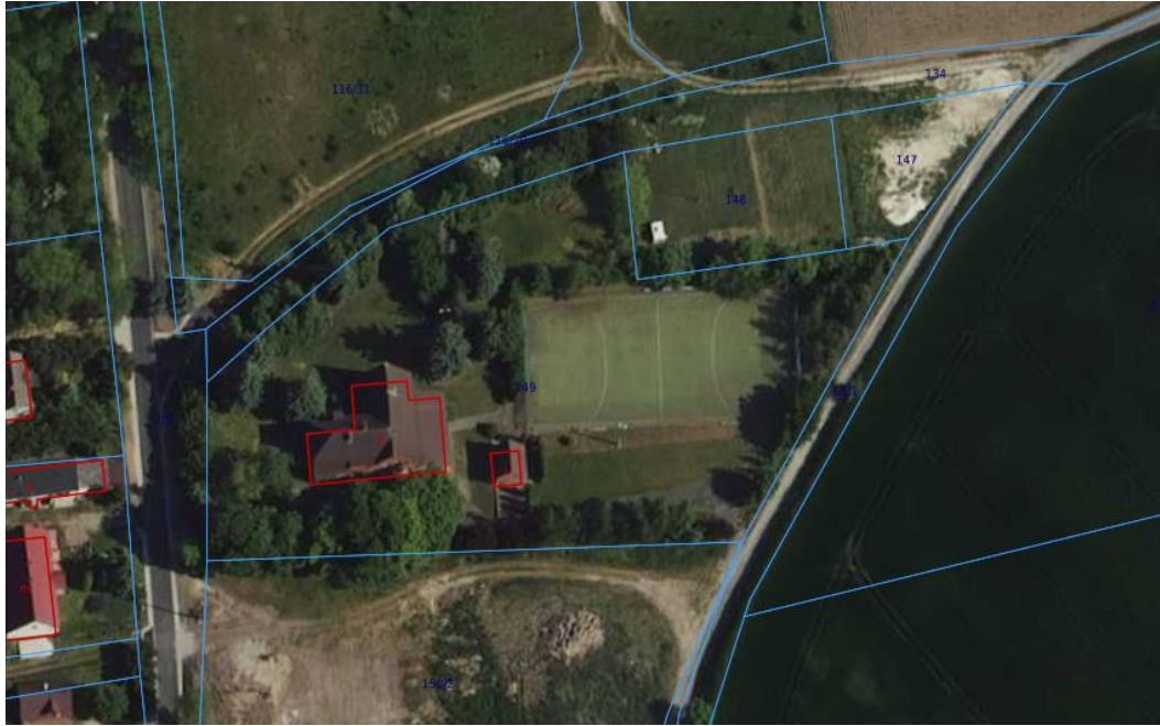
Rys. 2 Lokalizacja budynków na działce