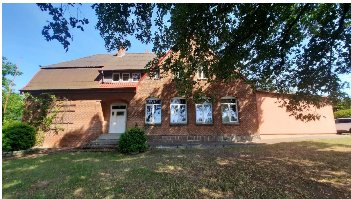
Rys. 5 Elewacja południowa