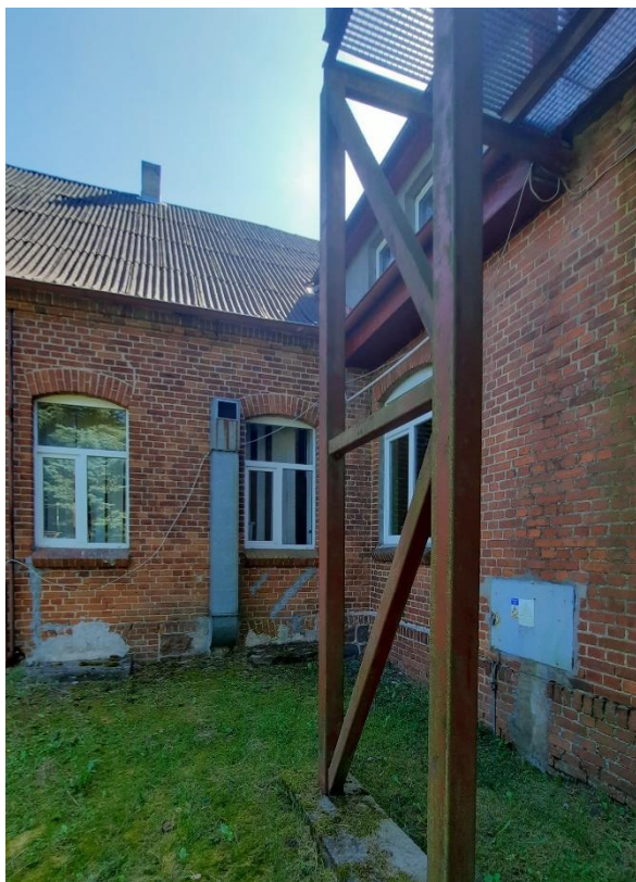
Rys. 7 Elewacja zachodnia