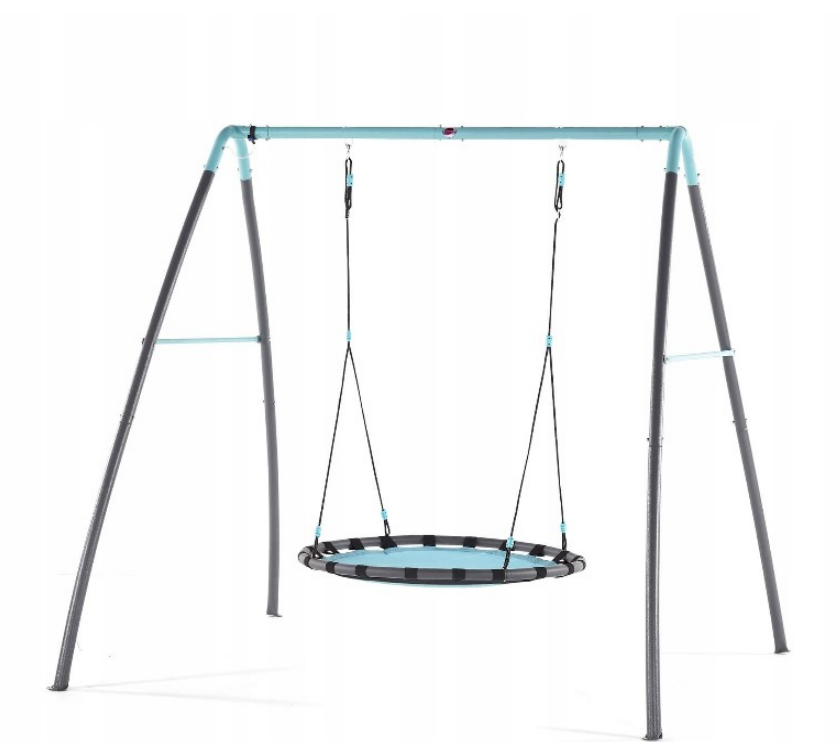
Rys. 2 Huśtawka typu „Bocianie Gniazdo”

Zamawiający zastrzega, że pokazane ilustracje mają charakter poglądowy i obrazują elementy jakie spodziewa się uzyskać Zamawiający.