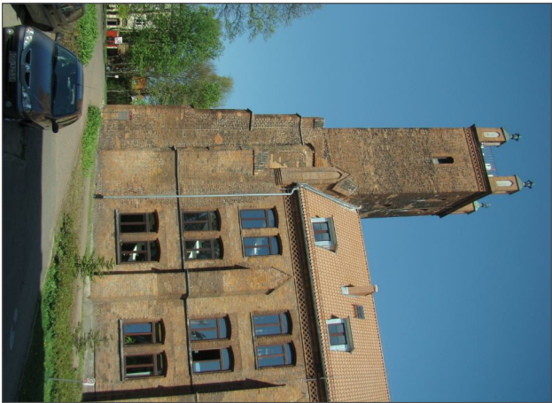
■ Elewacja boczna (połud.) od strony parkingu. ROK 2014