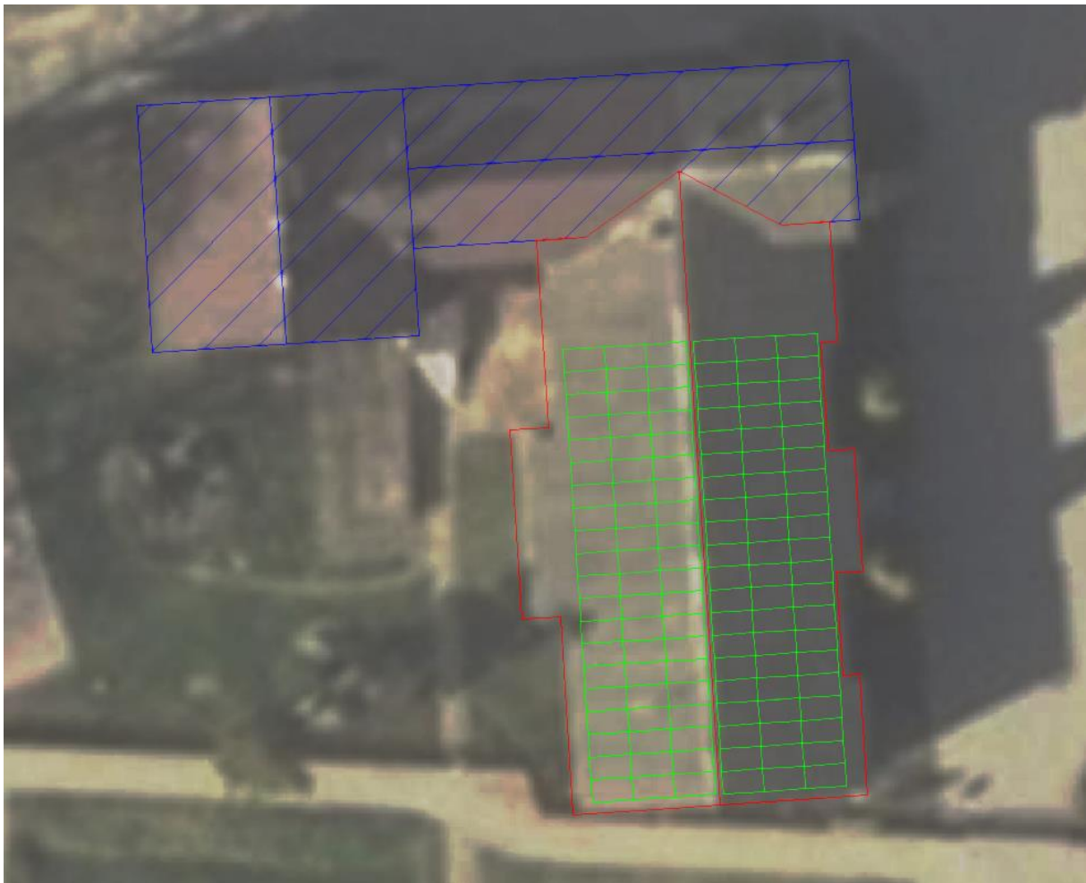
Rozmieszczenie instalacji fotowoltaicznej na dachu budynku Urzędu Gminy.

Instalacja fotowoltaiczna ma powstać na dachu budynku Urzędu Gminy Gołymín-Ośrodek.