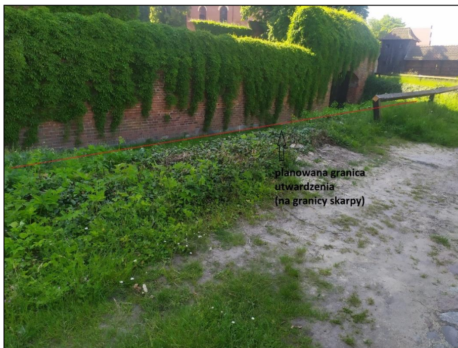
Fot. 2 Widok granicy planowanego utwardzenia po stronie południowej (od strony Gdaniska)

Muzeum Zamkowe w Malborku ul. Starościńska 1 82-200 Malbork