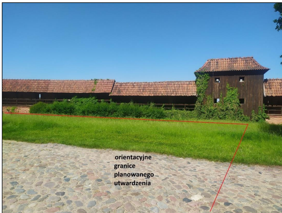
Fot. 3 Widok granicy planowanego utwardzenia od strony północnej z zaznaczeniem, iż faktyczny kształt placu manewrowego powinien spełniać wymogi przepisowe (w tym promienie skrętu).