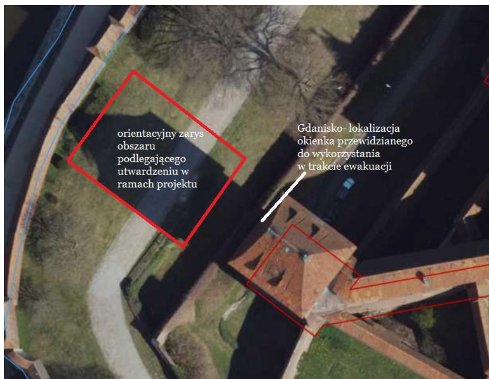
Rys. 2 Lokalizacja i orientacyjny zarys obszaru będącego w zakresie opracowania projektowego

Muzeum Zamkowe w Malborku ul. Starościńska 1 82-200 Malbork