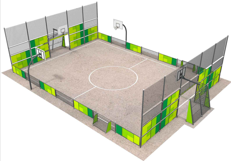
PROJEKTOWANE OGRODZENIE SYSTEMOWE