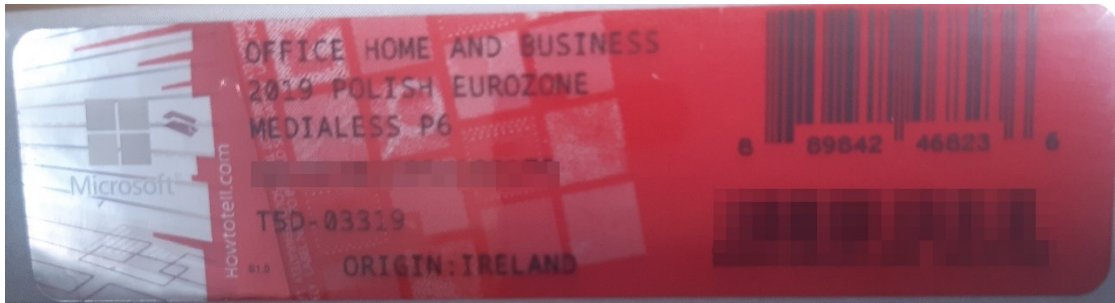
Rys. 2 przykładowy kod zabezpieczony przez producenta systemu Microsoft Windows Office Home&Business z wymazanym, znajdującym się w prawym dolnym rogu numerem seryjnym produktu. Kod licencyjny znajduje się w środku szczelnie zapakowanego i zafoliowanego pudełka (Rys. 3)