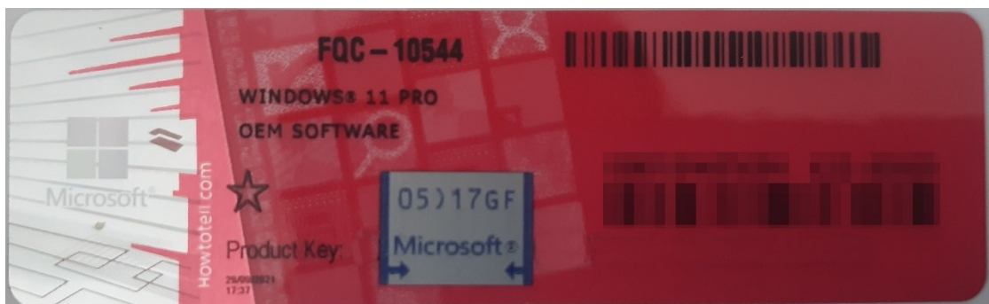
Rys. 1 przykładowy kod zabezpieczony przez producenta systemu Microsoft Windows 11 (takie same naklejki mają Windows 10) z wymazanym, znajdującym się przed i za szarą naklejką kodem licencyjnym

Poniższe zdjęcie obrazuje obecnie stosowane zabezpieczenia producenta firmy Microsoft (klucz systemu jest zabezpieczony naklejką hologramową przez producenta. Po jej zdrapaniu uzyskujemy dostęp do oryginalnego klucza):