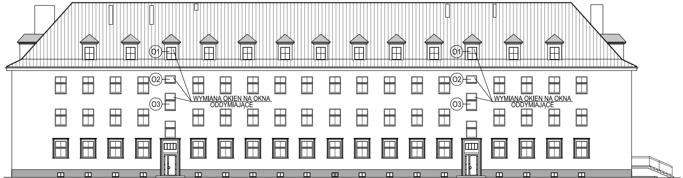
ELEWACJA ZACHODNIA - STAN PROJEKTOWANY 1:200 BUDYNEK "D"