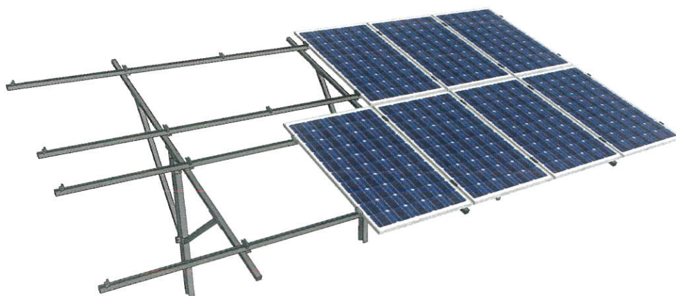
Rys. 1. Wizualizacja systemu montażowego oraz sposobu mocowania modułów fotowoltaicznych

Dla projektowanych modułów fotowoltaicznych proponuje się zastosowanie konstrukcji montażowej wolnostojącej na grunt (2 rzędy pionowo):