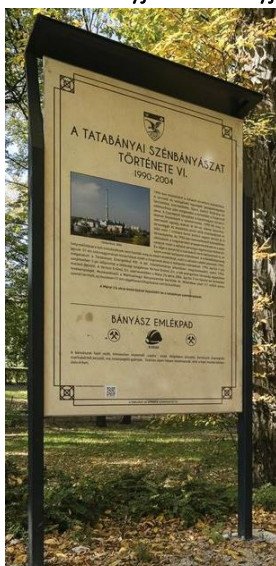
e. tablica informacyjno-edukacyjna – 1 szt.