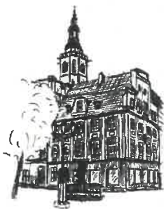
Rynek Wleża ratuszowa