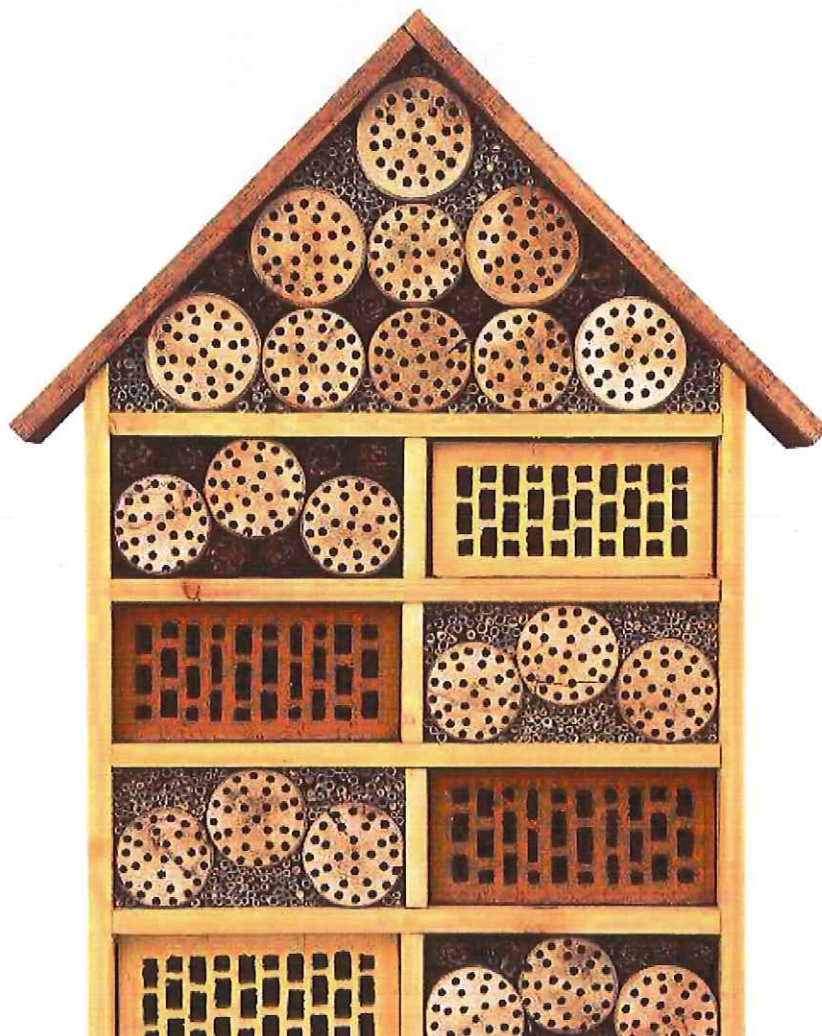
Zdjęcie przedstawiający przykładowy domek dla owadów