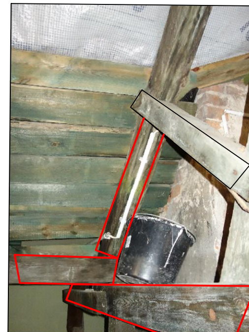
Przegnita w wyniku nieszczelnego koryta krokiew płatew i odcinek jętki przy ścianie- elementy do naprawy .