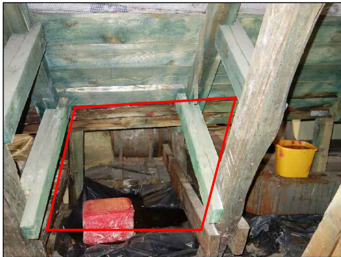
Przegnita podłoga pod koszem,zawilgocone zastrzały i deski koszowe.Do wymiany elementy uszkodzone po zdemontowaniu blachy w koszach-obmiar pobrać z natury