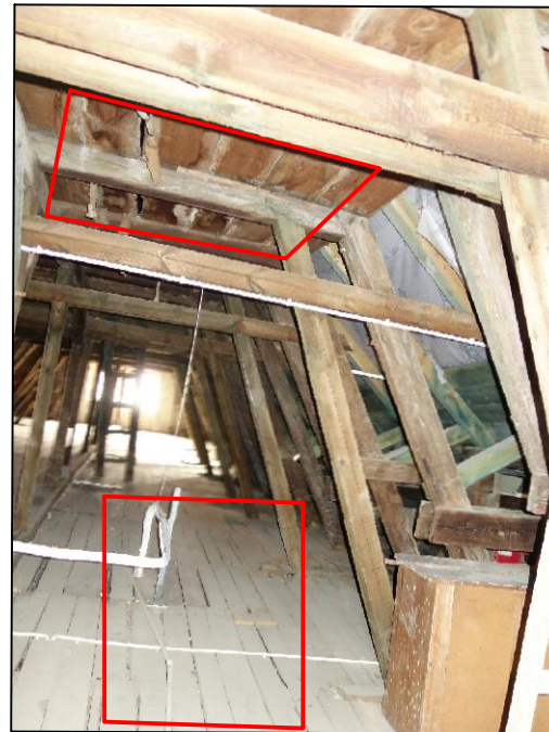
Spruchniałe deski podłogowe i podsufitka z bali drewnianych. Element do wymiany po dokonaniu odkrywek.