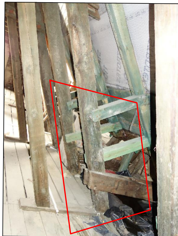
Zawilgocone krokwie,zastrzały , płatew, podłoga z desek i słupki. Elementy do wymiany.Do wymiany elementy uszkodzone po zdemontowaniu blachy w koszach-obmiar pobrać z natury.