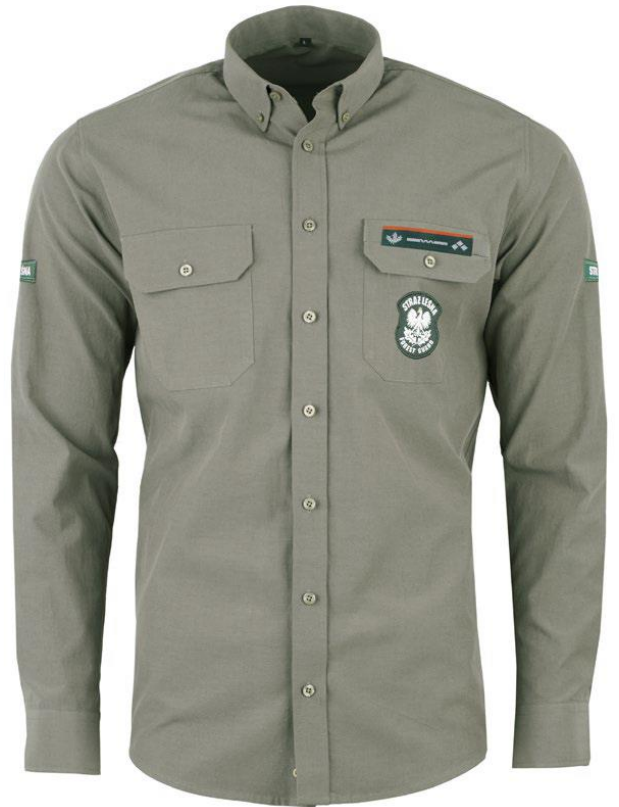
Koszule robocze krótki i długi rękaw