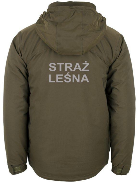
Kurtka ocieplana z podpinką