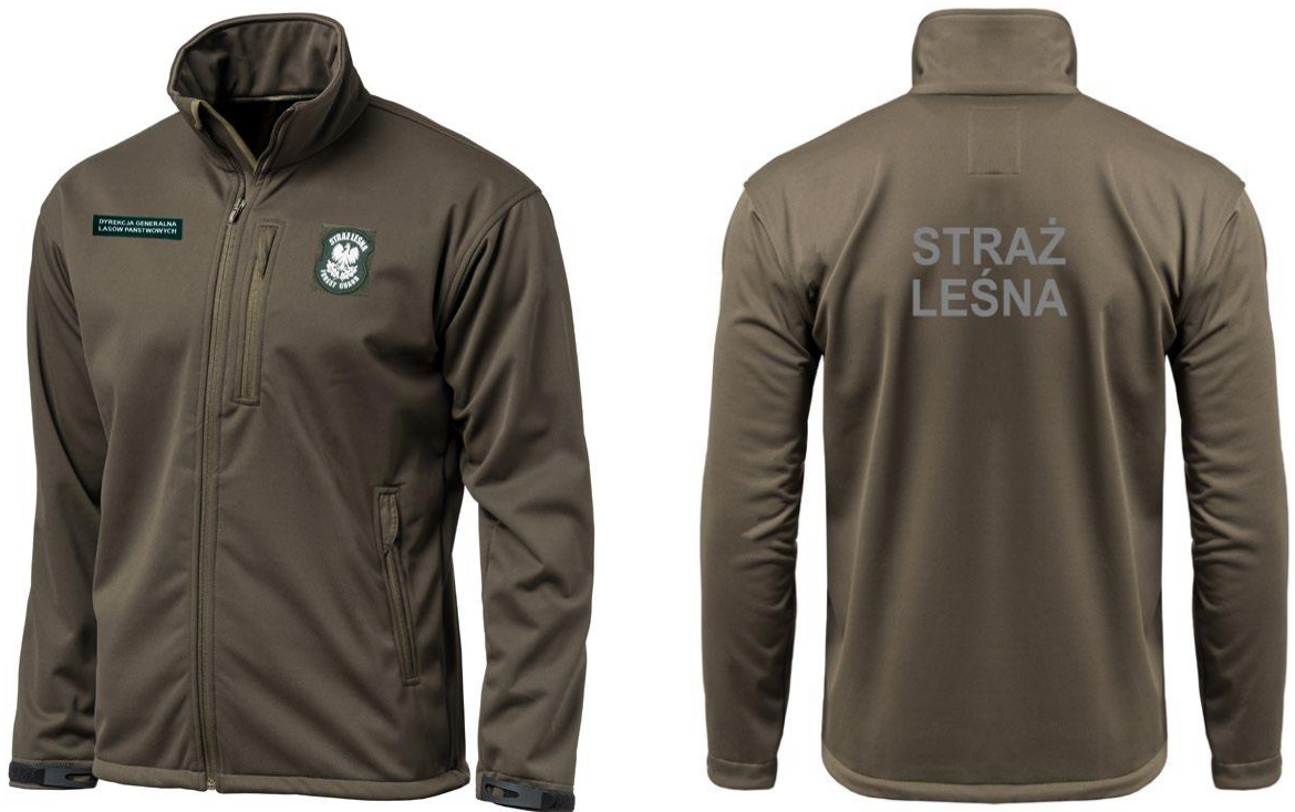
Bluza typu softshel