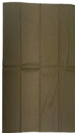
Szalik – chusta wielofunkcyjna – komin