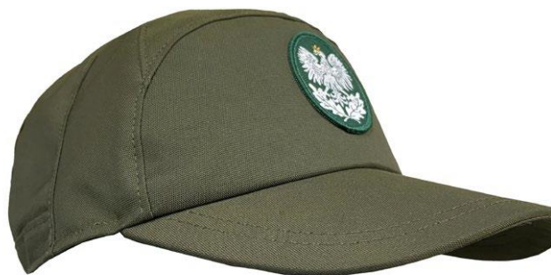
Czapka przeciwdeszczowa z daszkiem