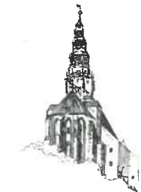
Kościół pw. Św. Stanisława i Św. Wacława Katedra Diecezji Świdnickiej

„Otwarcie ofert następuje za pomocą Platformy niezwłocznie po upływie terminu składania ofert, tj. w dniu 08.04.2024 r. o godz. 10:00. ”