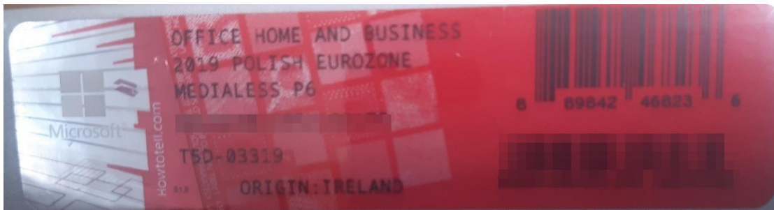
Rys. 2 przykładowy kod zabezpieczony przez producenta systemu Microsoft Windows Office Home&Business z wymazanym, znajdującym się w prawym dolnym rogu numerem seryjnym produktu. Kod licencyjny znajduje się w środku szczelnie zapakowanego i zafoliowanego pudełka (Rys. 3)