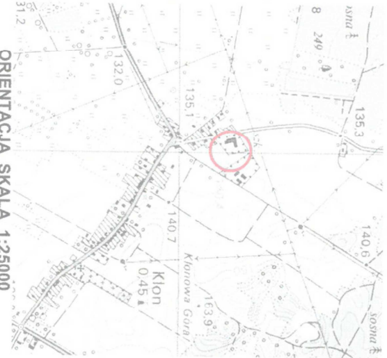
ORIENTACJA SKALA 1:25000