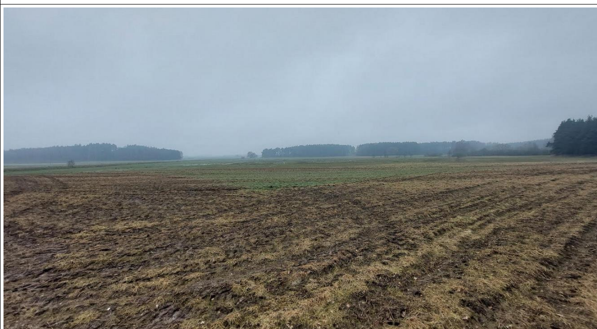
fot. widok na teren