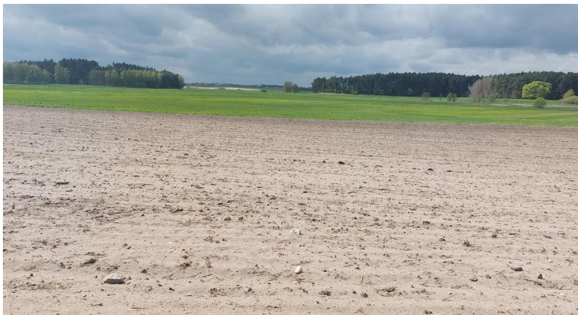
fot. widok na teren