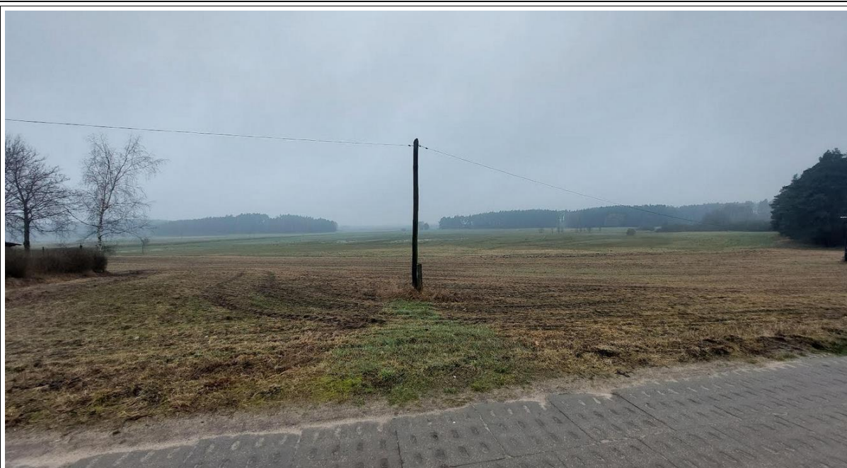
fot. widok na teren z drogi gminnej