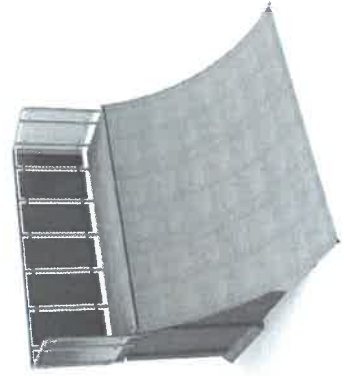
11721 Quarter- Pipe high