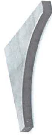
11738 Olly Box zaokraglony