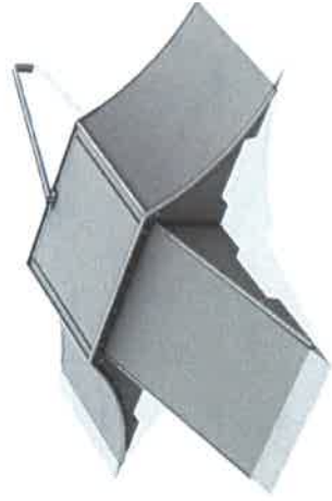
11786 Fun Box type A