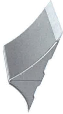
11755 Spine- Ramp