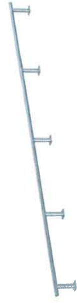
11750 Rail 30