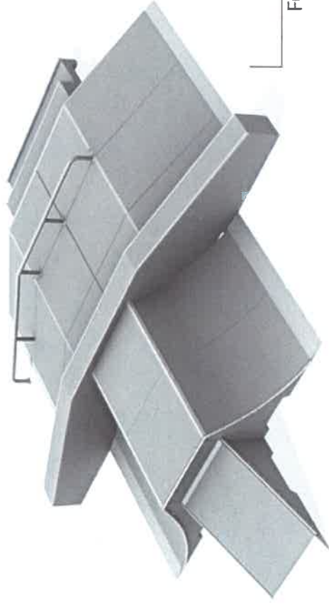
11792 Fun Box 6