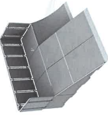
11793 Quarter 2