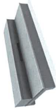
11771 Olly Box 3