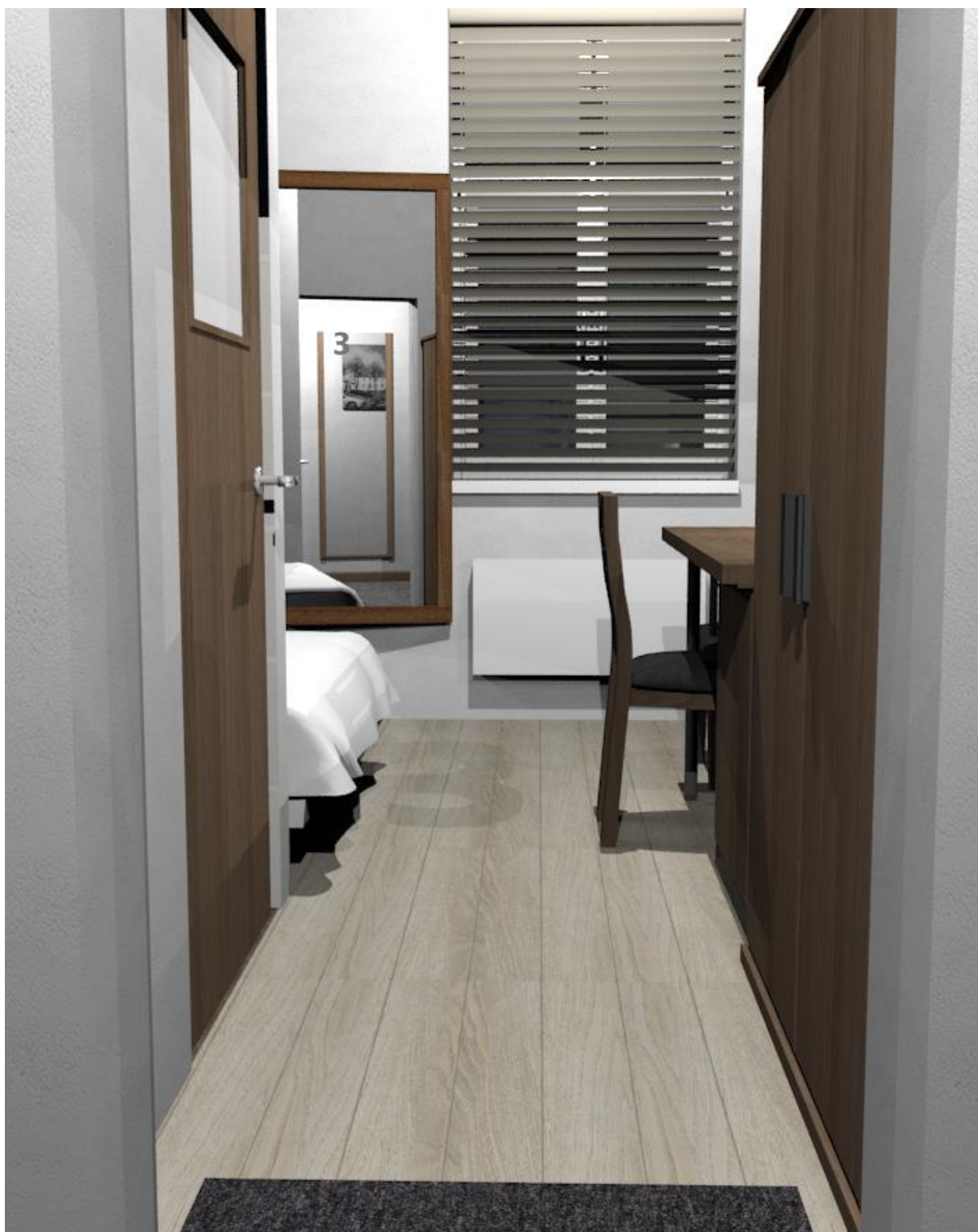
Rys nr 15. Pokój 3 Widok z korytarza