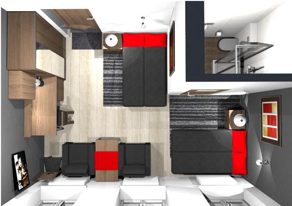
Rys nr 6. Pokój 2 Widok z góry