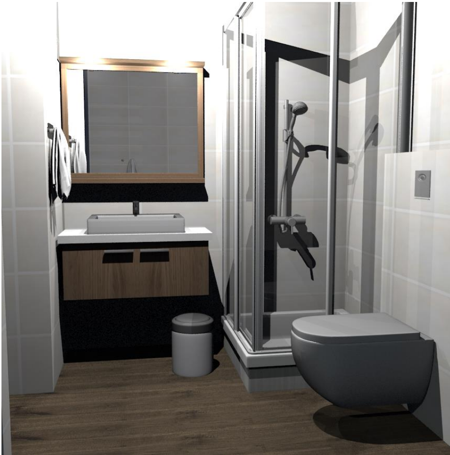
Rys nr 16. Pokój 3 łazienka od ściany