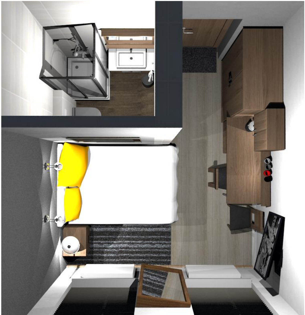
Rys nr 18. Pokój 4 Widok z góry