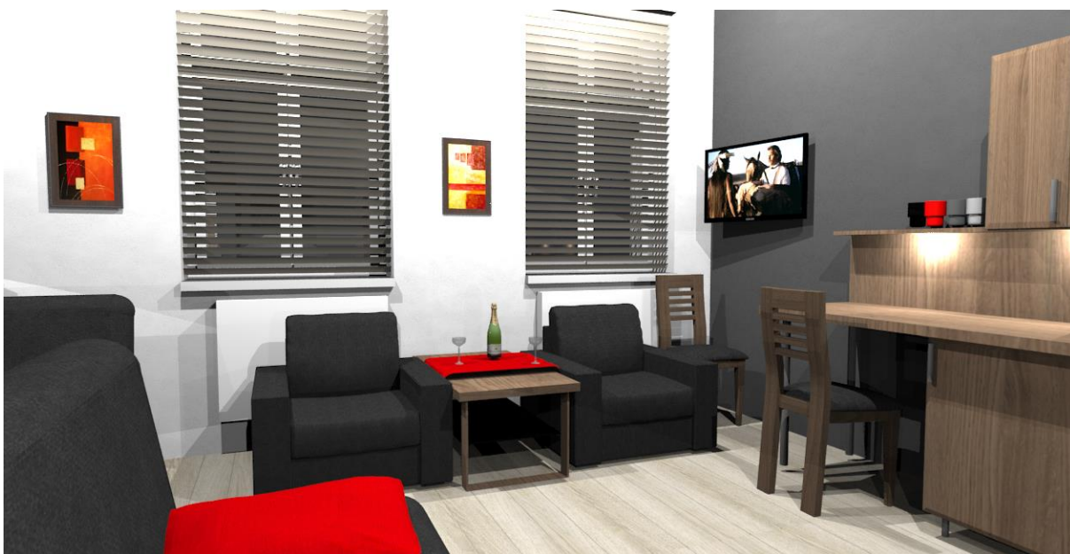
Rys nr 11. Pokój 2 Widok z drugiej kanapy