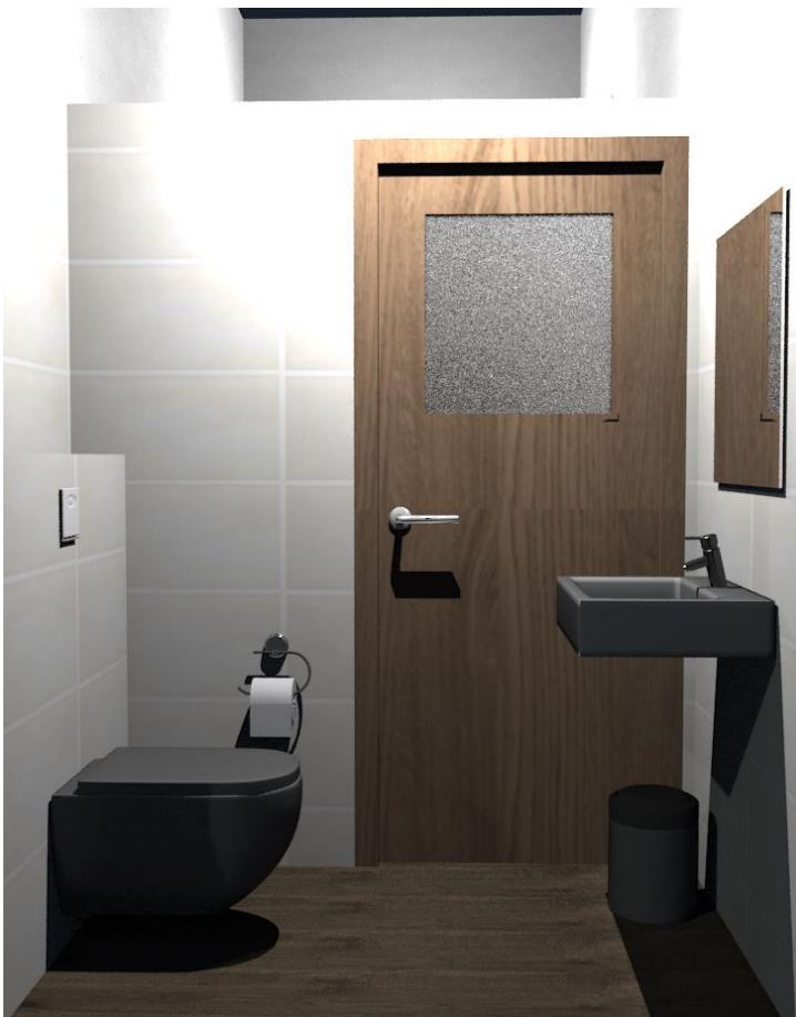
Rys nr 26. Gospodarcze. WC personelu widok od ściany