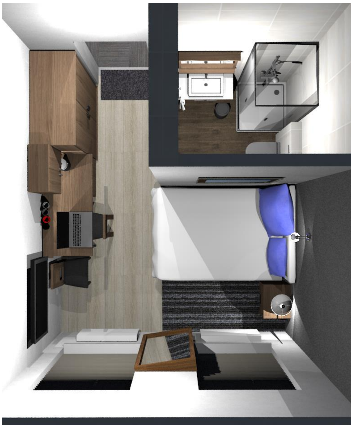
Rys nr 12. Pokój 3 Widok z góry