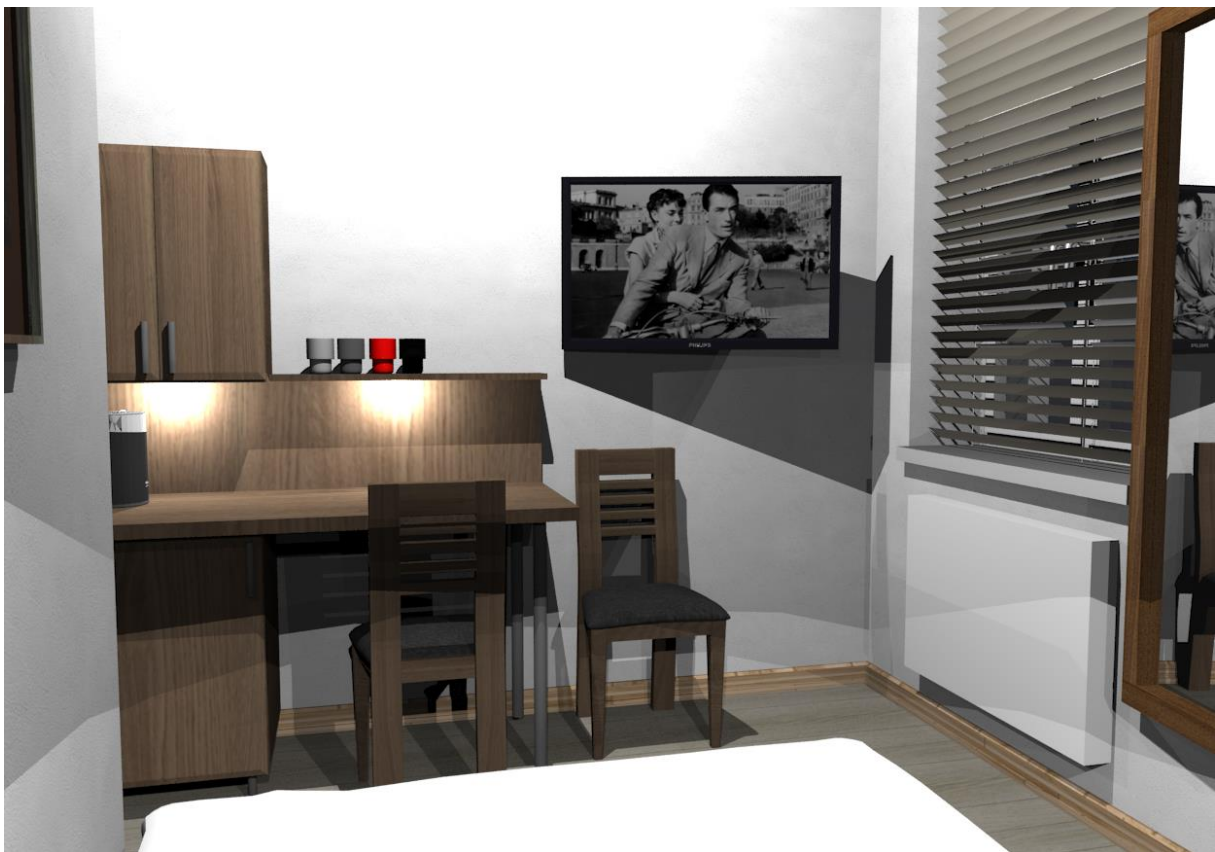
Rys nr 20. Pokój 4 Widok z łóżka