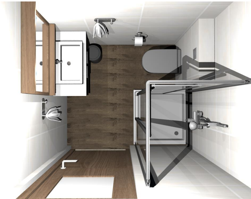
Rys nr 7. Pokój 2 Łazienka z góry