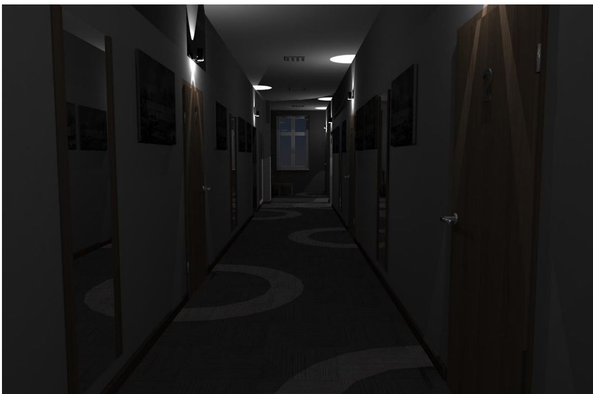
Rys nr 22. Korytarz Widok z głębi przy oświetleniu awaryjnym