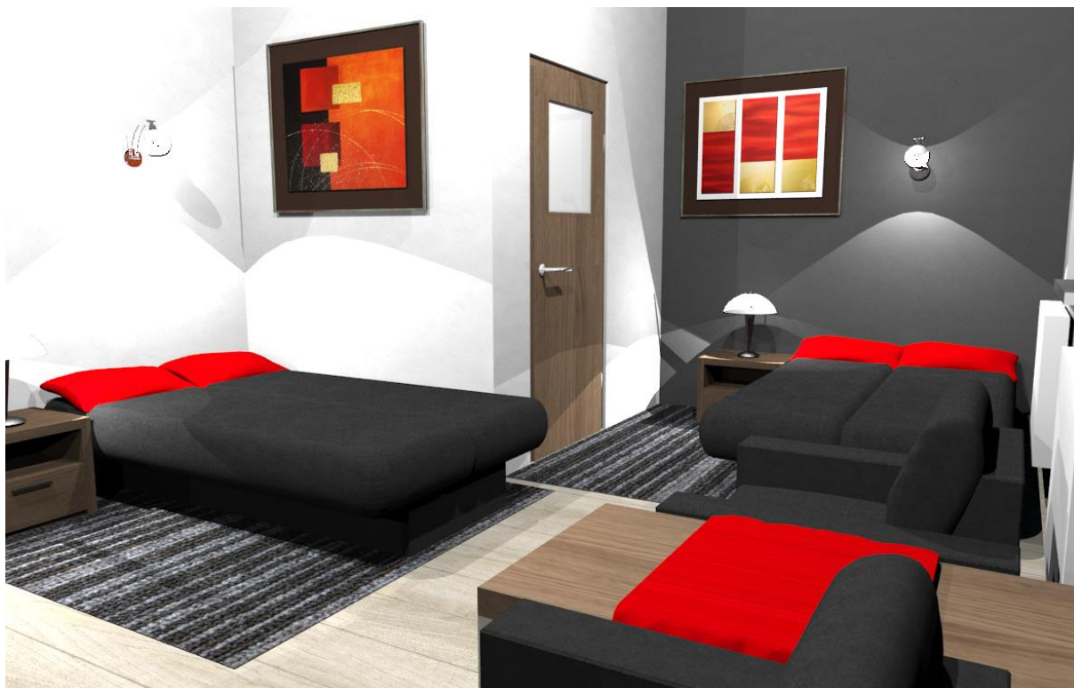
Rys nr 8. Pokój 2 Widok od str okna – kanapy rozłożone do spania