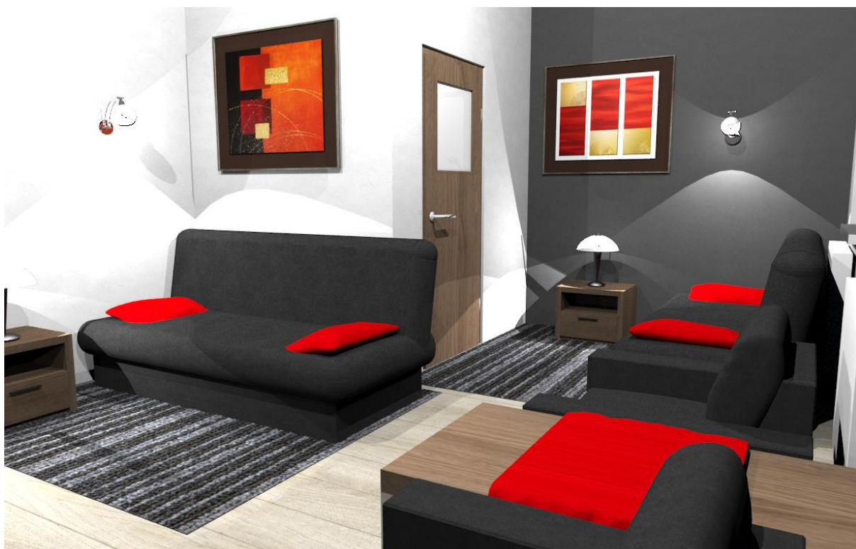
Rys nr 9. Pokój 2 Widok od str okna – kanapy złożone do siedzenia