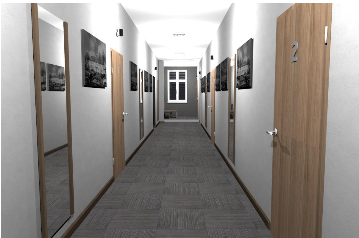
Rys nr 21. Korytarz Widok z głębi przy pełnym oświetleniu