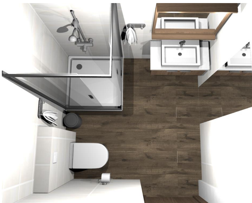
Rys nr 3. Pokój 1 Widok z góry- łazienka