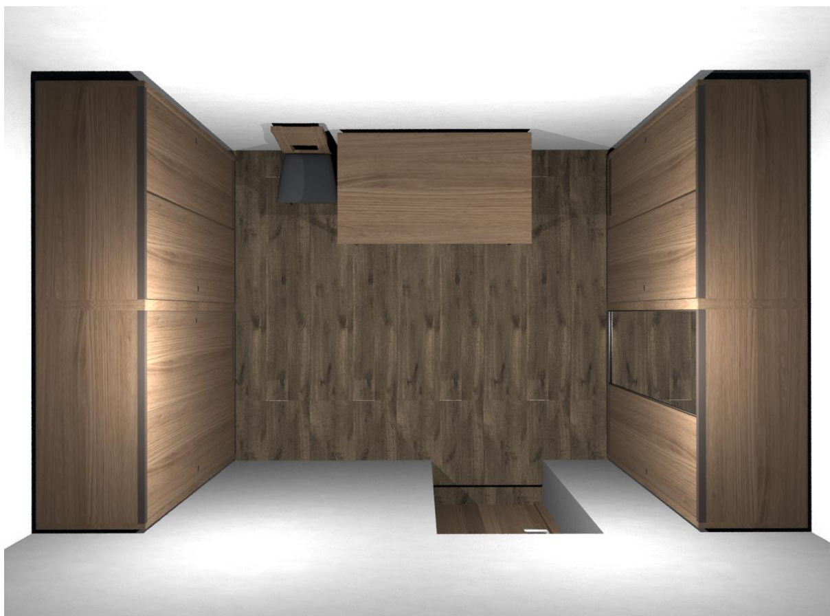
Rys nr 27. Magazyn. widok z góry