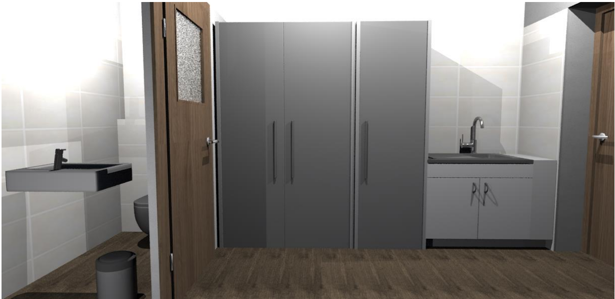
Rys nr 25. Gospodarcze. Widok od ściany okiennej