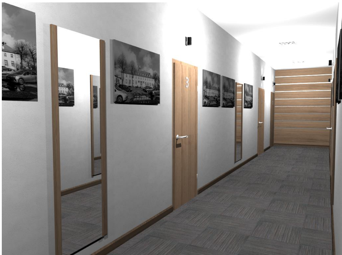
Rys nr 23. Korytarz widok od okna (1)