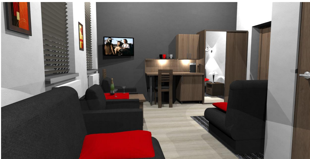
Rys nr 10. Pokój 2 Widok z kanapy przy oknie