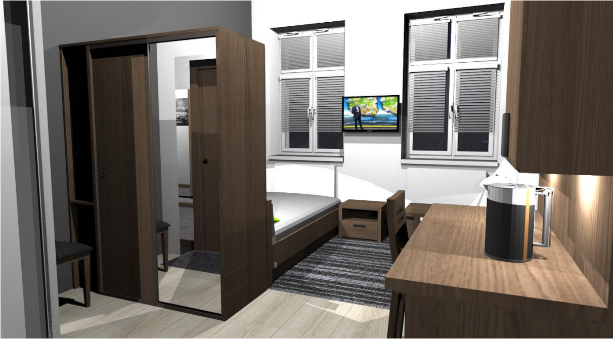
Rys 4. Pokój 1 Widok od str łazienki