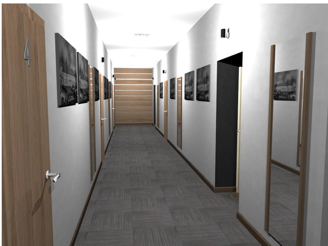
Rys nr 24. Korytarz widok od okna (2)