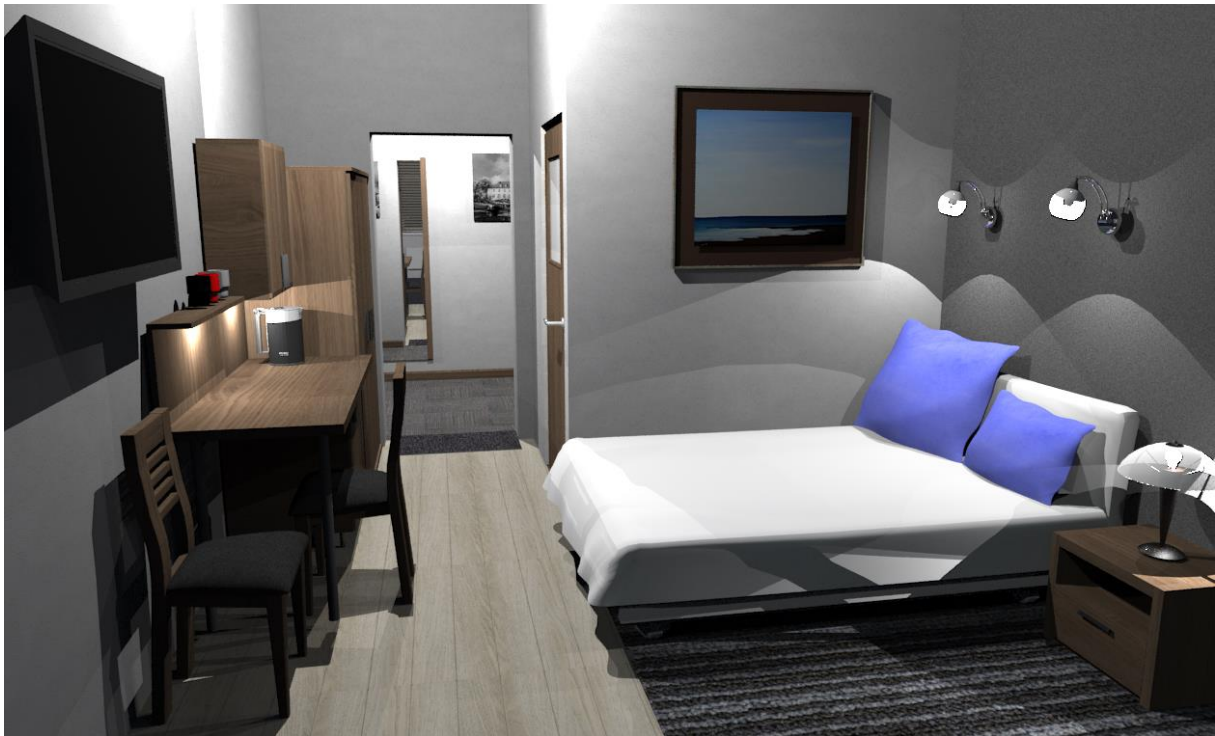
Rys nr 13. Pokój 3 Widok od okna