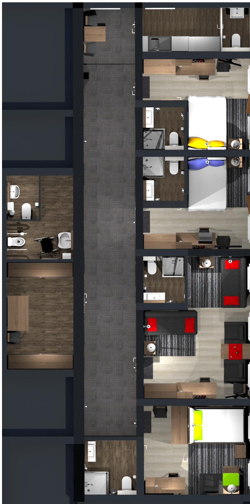
nr 1. Widok ogólny na część hotelową – aksonometria Pokój nr 1