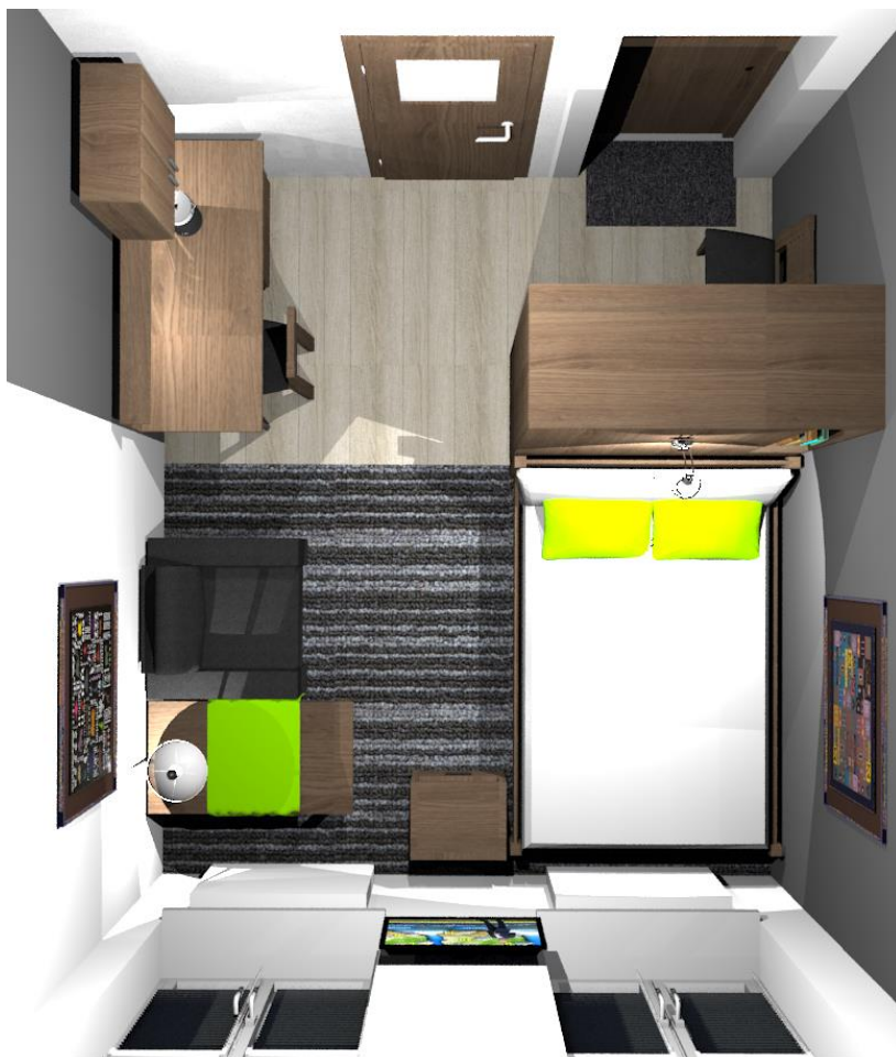
Rys nr 2. Pokój 1 Widok z góry – pokój