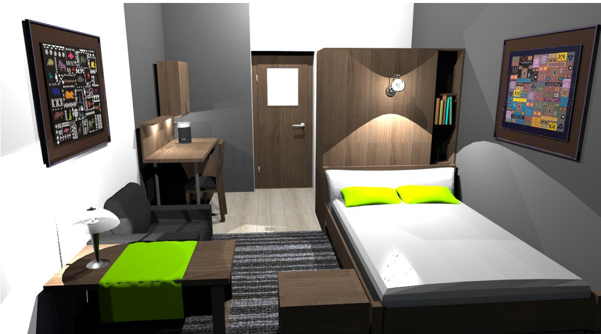
Rys nr 5. Pokój 1 Widok od str okna