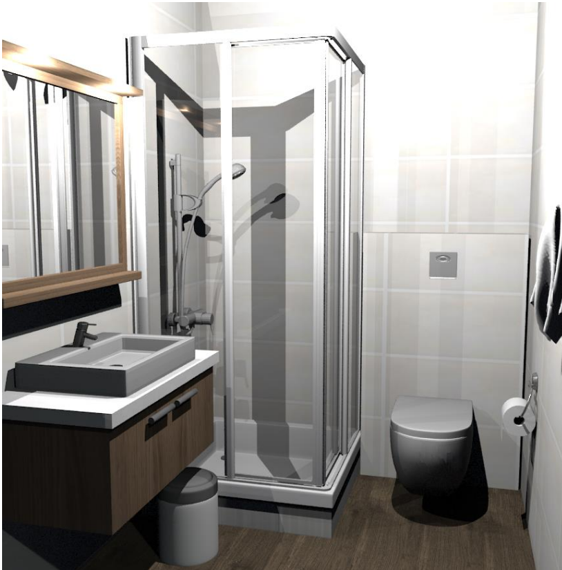
Rys nr 17. Pokój 3 łazienka od str drzwi