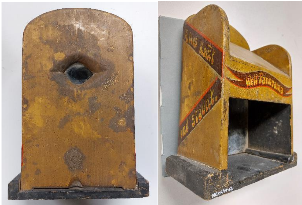
Skrzynka Peep-Show (NCKF/M-62)

Szacowanie powinno zawierać koszty wykonania dokumentacji z przebiegu prac konserwatorskich oraz transport z i do siedziby Zamawiającego.