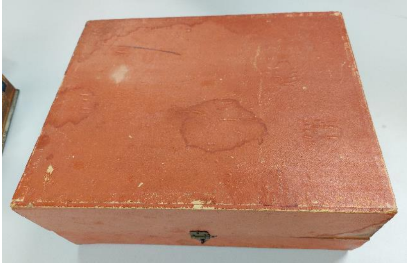
Luneta projekcyjna Newton (NCKF/M-277/1)