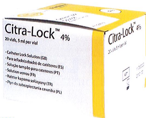
Pudełko zawierają 20 fiolek po 5 ml