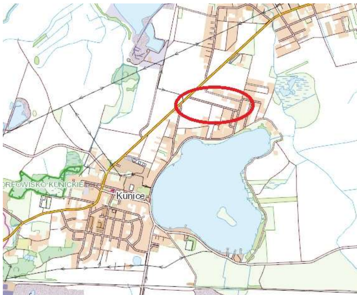
Fot. 2 – mapa poglądowa