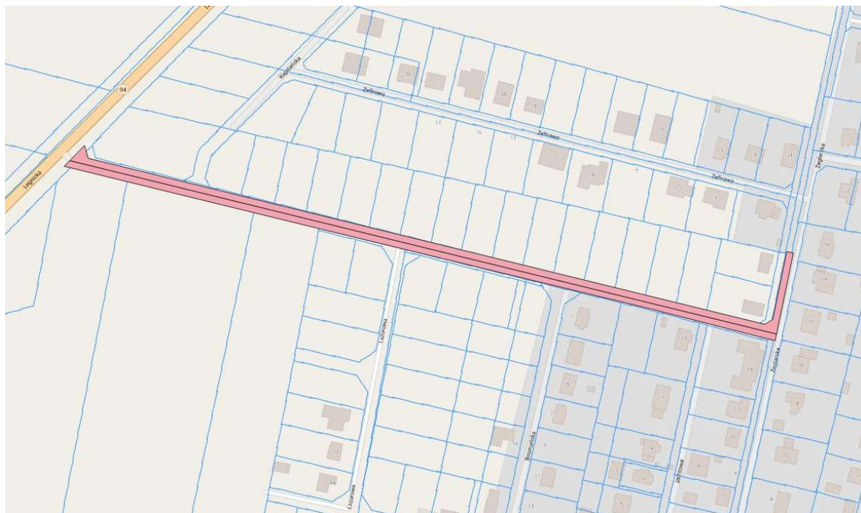
Fot. 3 – oznaczenie działek

Przedmiotem zamówienia jest zaprojektowanie oraz wykonanie robót i obejmuje: