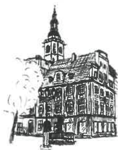
Rynek Wieża ratuszowa

Sporządziła: I. Fecko Stanowisko: Inspektor tel. 74 856-28-50