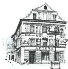
Kamienica „Pod Bykami”