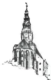
Kościół pw. Św. Stanisława i Św. Wacława Katedra Diecezji Świdnickiej