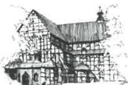
Kościół Pokoju pw. Św. Trójcy Wpisany na listę UNESCO