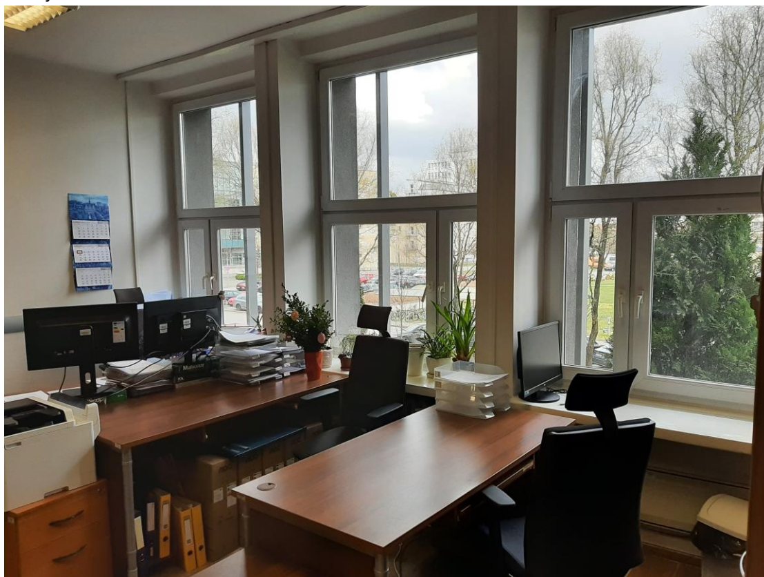
Pokój nr 116