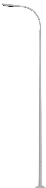
a. słup oświetleniowy