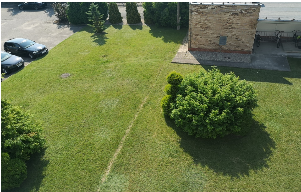
Rys.2 Planowane miejsce montażu paneli fotowoltaicznych. W tle budynek, w którym znajduje się licznik prądu