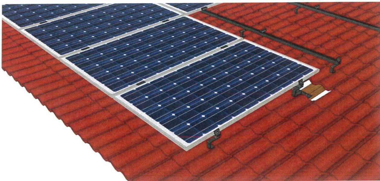
Rys. 1. Wizualizacja systemu montażowego oraz sposobu mocowania modułów fotowoltaicznych

Dla projektowanych modułów fotowoltaicznych proponuje się zastosowanie konstrukcji montażowej na dachówkę