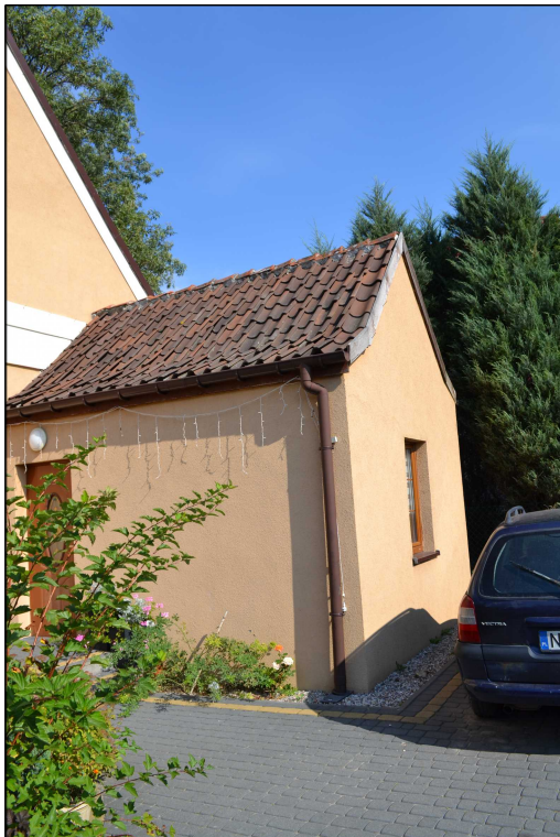
FOT. 17 Elewacja południowo- zachodnia obiektu.