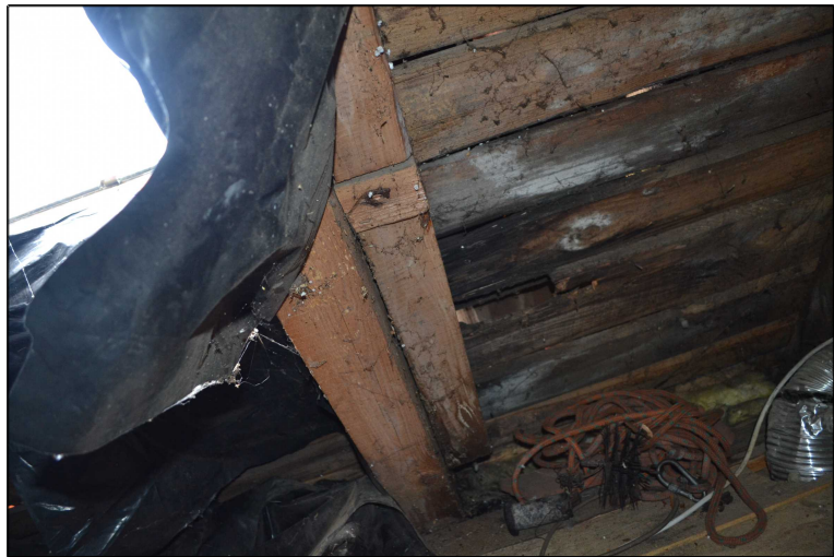
FOT. 19 Widok więźby dachowej.