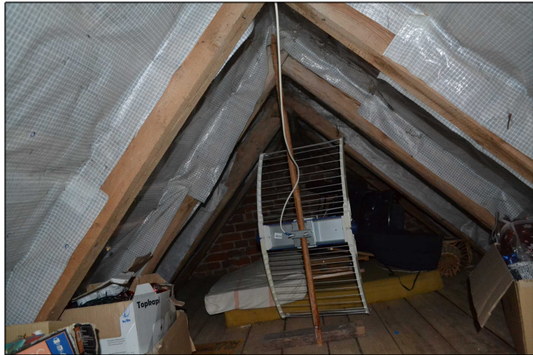
FOT. 15 Widok więźby dachowej.