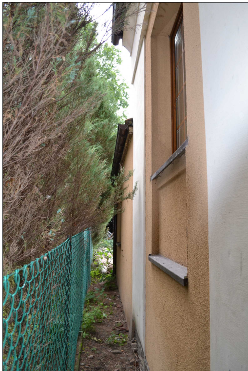
FOT. 21 Elewacja północno-wschodnia obiektu.