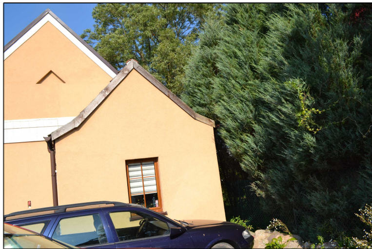
FOT. 14 Elewacja południowo- wschodnia obiektu.