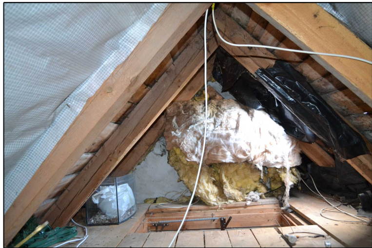
FOT. 16 Widok więźby dachowej.