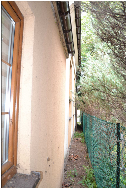
FOT. 20 Elewacja północno-wschodnia obiektu.