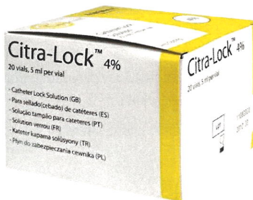
Pudełka zawierają 20 fiolek po 5 ml