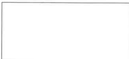
Pieczęć firmowa Wykonawcy