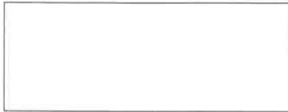
Pieczęć firmowa Wykonawcy