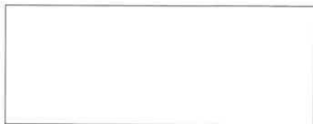
Pieczęć firmowa Wykonawcy