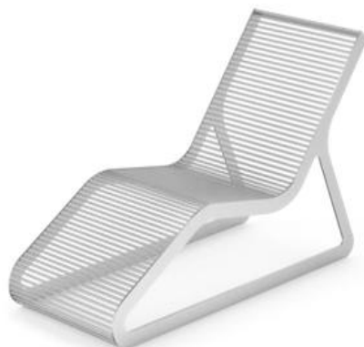
Leżanka- zdjęcie poglądowe