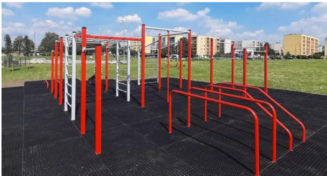
Przykład urządzenia wielofunkcyjnego- zdjęcie poglądowe- źródło zdjęcia: https://streetworkoutpark.pl/pyskowice/