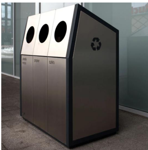
Zewnętrzny kosz na śmieci z trzema pojemnikami do segregacji odpadów- zdjęcie poglądowe