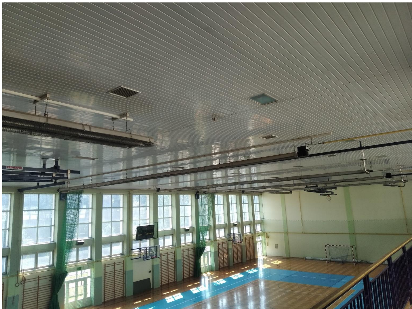
Rysunek 7. Hala sportowa rozpatrywanego obiektu