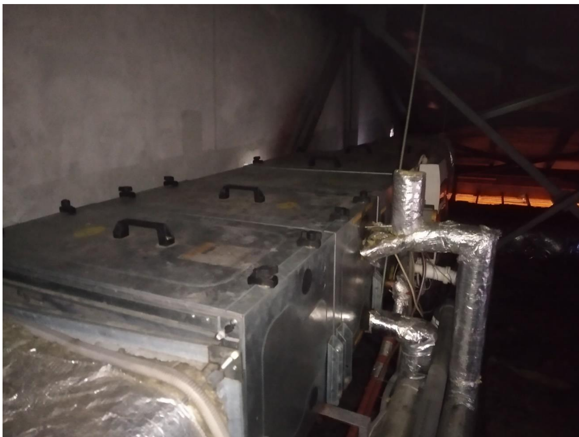
Rysunek 3. system wentylacyjny w rozpatrywanym obiekcie