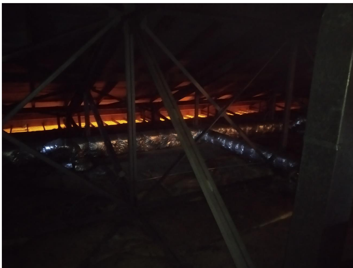
Rysunek 4. system wentylacyjny w rozpatrywanym obiekcie