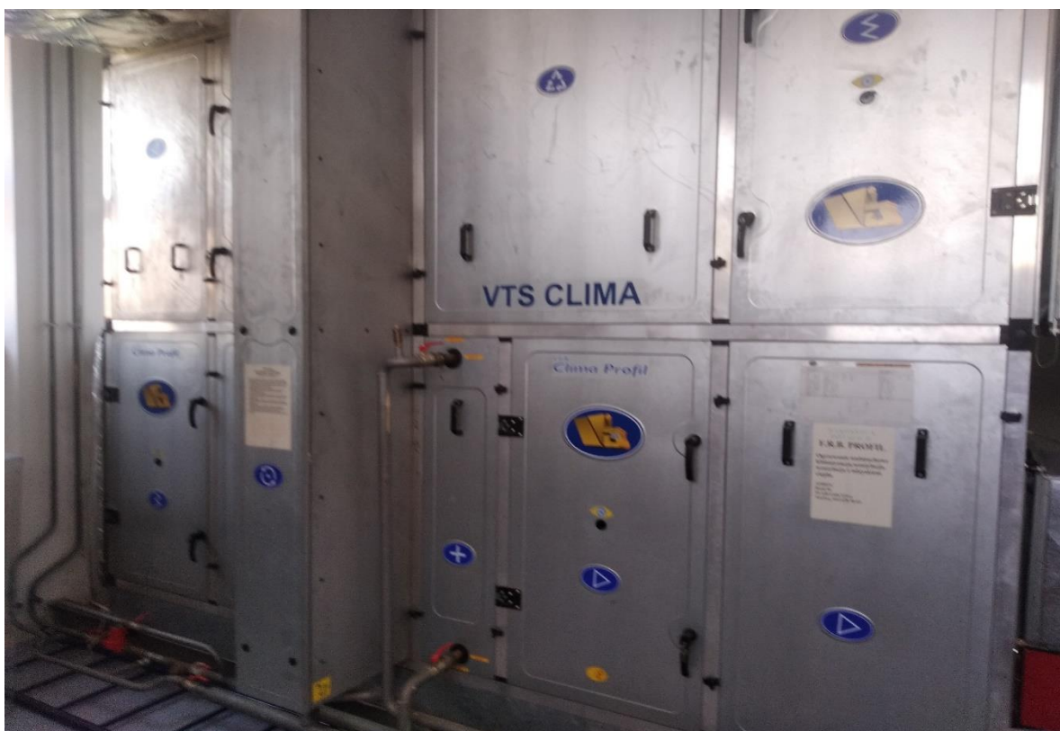
Rysunek 5. centrala wentylacyjna w rozpatrywanym obiekcie