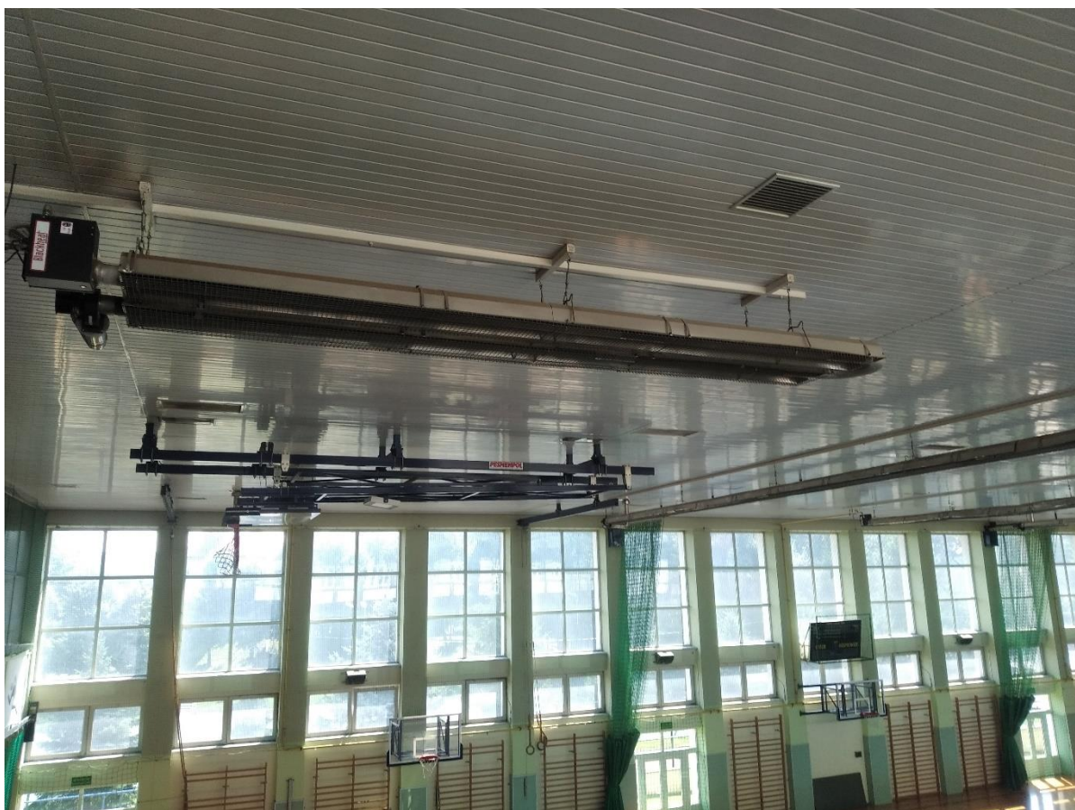
Rysunek 6. Promienniki gazowe na hali sportowej