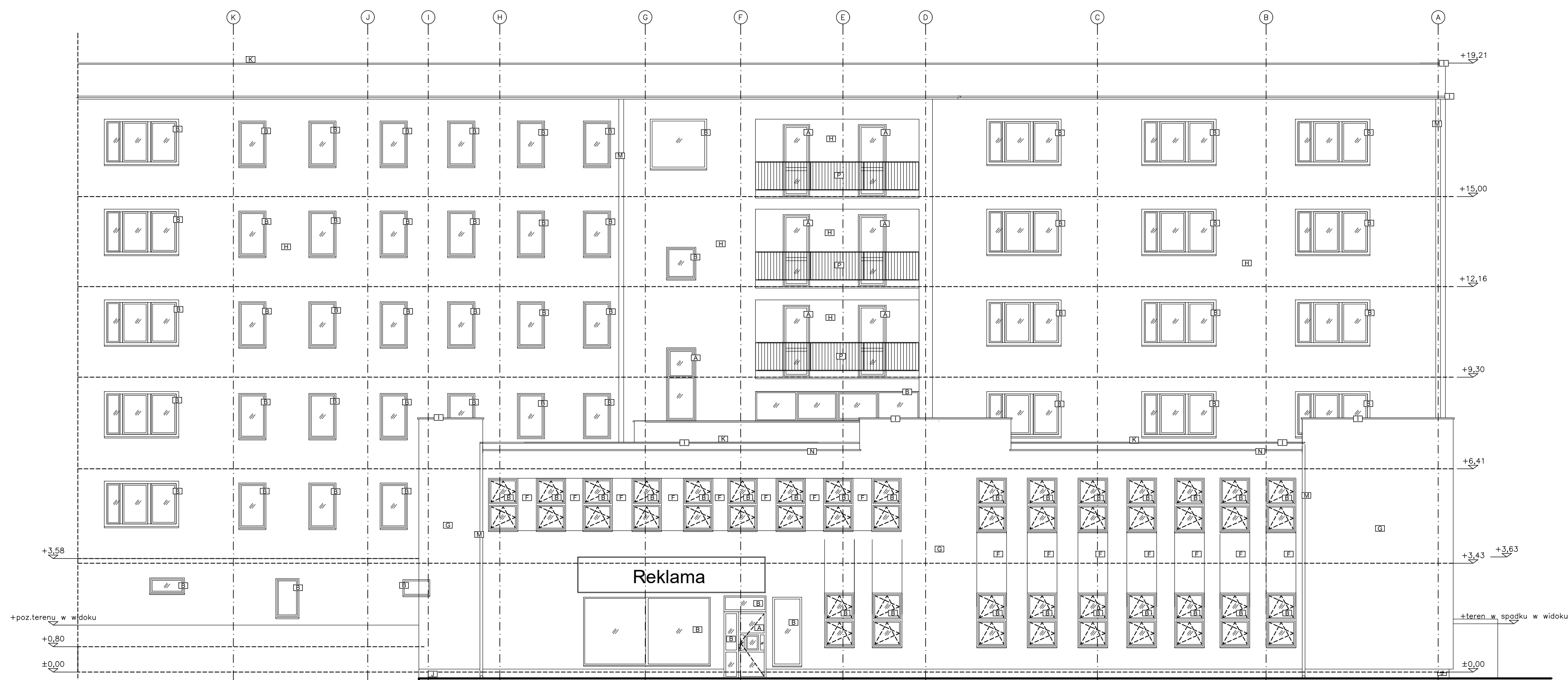
ELEVACJA W1, SKALA 1:100