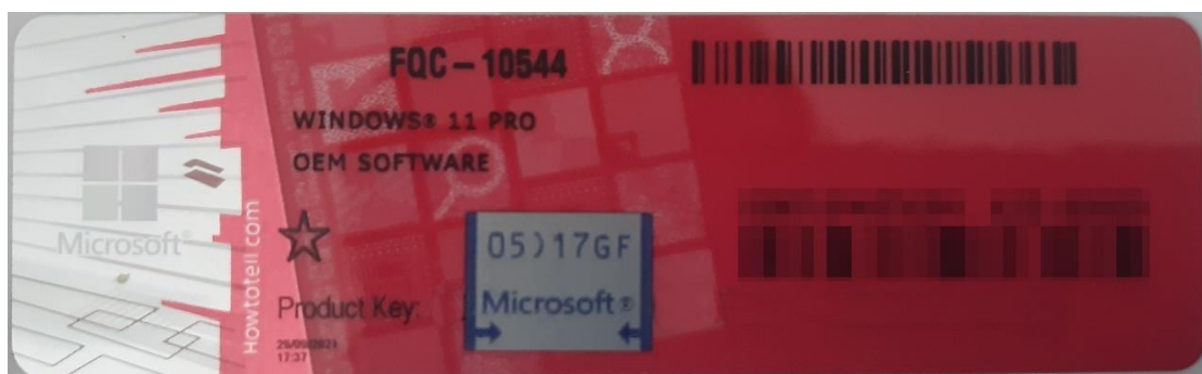
Rys. 1 przykładowy kod zabezpieczony przez producenta systemu Microsoft Windows 11 (takie same naklejki mają Windows 10) z wymazanym, znajdującym się przed i za szarą naklejką kodem licencyjnym

Poniższe zdjęcie obrazuje obecnie stosowane zabezpieczenia producenta firmy Microsoft (klucz systemu jest zabezpieczony naklejką hologramową przez producenta. Po jej zdrapaniu uzyskujemy dostęp do oryginalnego klucza):