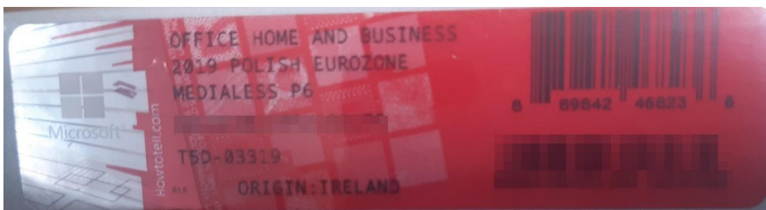
Rys. 2 przykładowy kod zabezpieczony przez producenta systemu Microsoft Windows Office Home&Business z wymazanym, znajdującym się w prawym dolnym rogu numerem seryjnym produktu. Kod licencyjny znajduje się w środku szczelnie zapakowanego i zafoliowanego pudełka (Rys. 3)