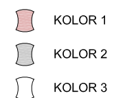
SPOSÓB UŁOŻENIA PŁYTEK - SCHEMAT

UWAGA - OSTATECZNY WYBÓR SPOSOBU UŁOŻENIA PŁYTEK PO PRZEDSTAWIENIU PRÓBEK ZGODNIE Z PROCEDURĄ WYBORU OPISANĄ W STWIORB ORAZ PO WYKONANIU MOCKUPU.