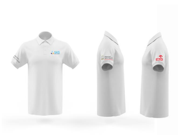
Rysunek nr 2. Poglądowa wizualizacja koszulka