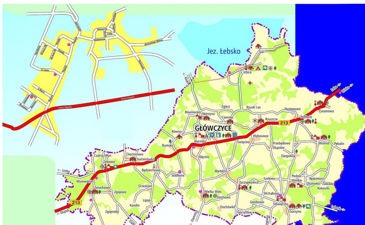
Załącznik nr 1C - mapa Gminy Główczyce