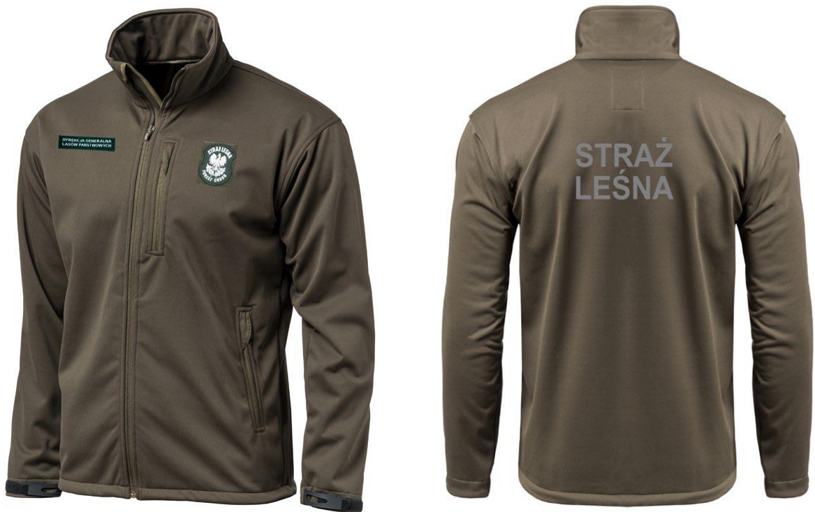
Bluza typu softshel