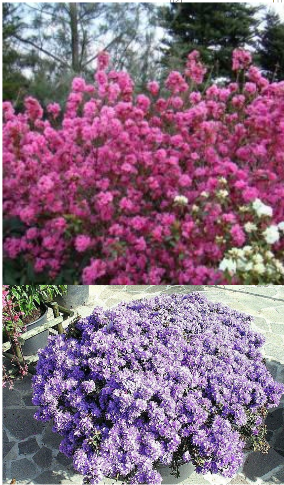
3. Różanecznik karłowaty