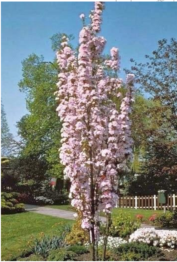
4. Wiśnia KOLUMNOWA