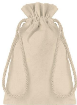
Obraz 2 Przykładowy woreczek - sakiewka