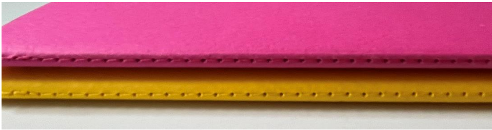
Obraz 7 Przykładowe notatniki – oprawa zeszytowa, szycie