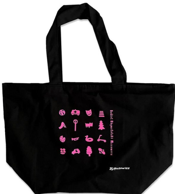
Obraz 3 Przykładowa torba bawełniana, czarna, zapinana na zamek