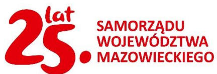
Obraz 10. Logotyp 25 lat Samorządu Województwa Mazowieckiego