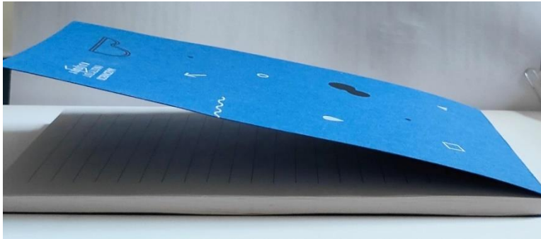
Obraz 4 Przykładowy notatnik klejony, złożony