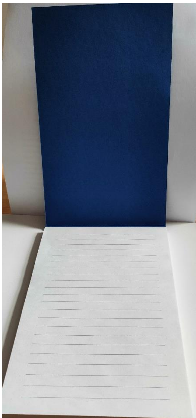
Obraz 5 Przykładowy notatnik klejony, rozłożony