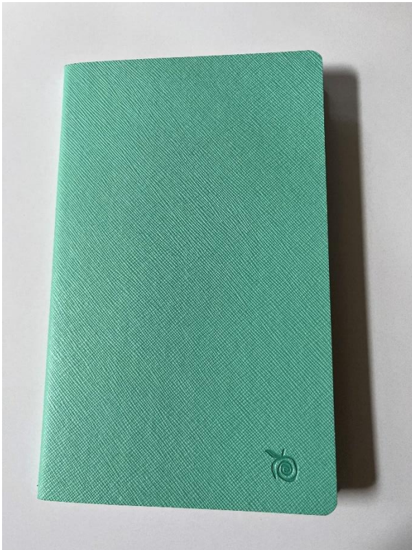
Obraz 8 Przykładowy notatnik jabłkowy