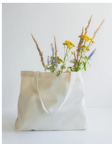
Obraz 1 Przykładowa torba bawełniana